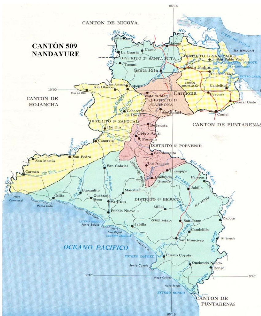
Figura N° 1. Cantón de Nandayure