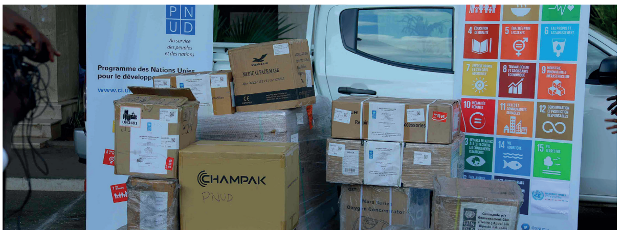
Matériels et équipements offerts par le Programme des Nations Unies pour le Développement au Ministère de la Santé