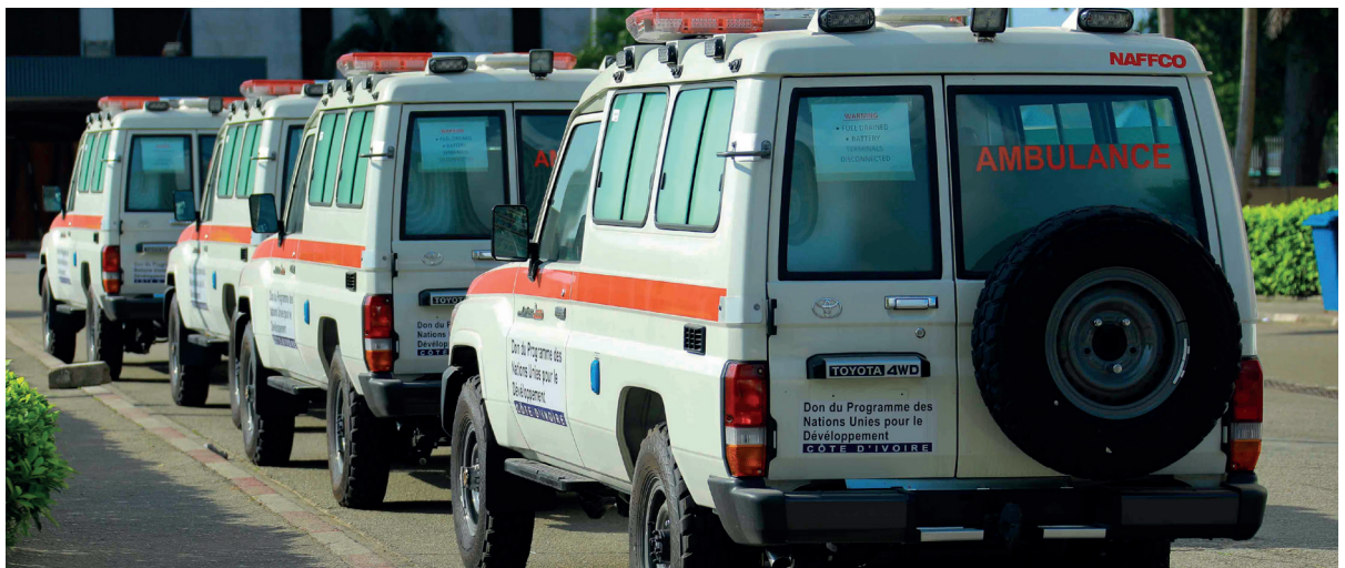
Les ambulances remises au Ministère de la Santé par le Programme des Nations Unies pour le Développement