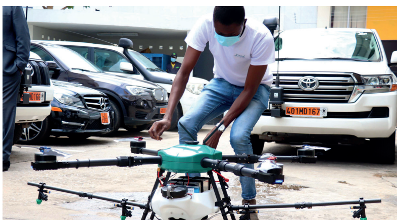
Le BLU BOT - un engin de grande portée