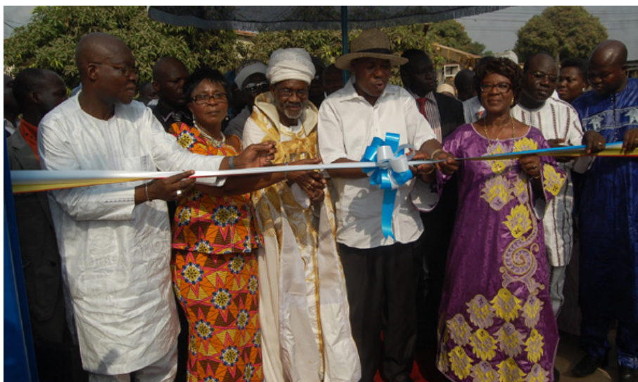
Le Chef de l'Etat (au centre) coupant le ruban symbolique d'inauguration du BPC de Parakou en présence du Ministre de la Défense, de la Ministre de la Microfinance, de l'Emploi des Jeunes et de la Représentante Résidente a.i. du PNUD

mis en service, le 18 janvier 2014 à Parakou par le Chef de l'Etat, Dr Boni Yayi, en présence de Madame