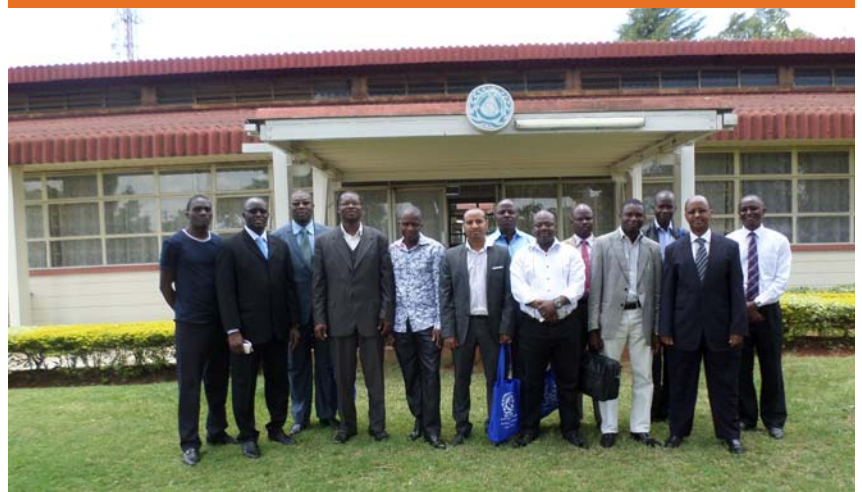
Photo de groupe au Centre régional de cartographie du Kenya