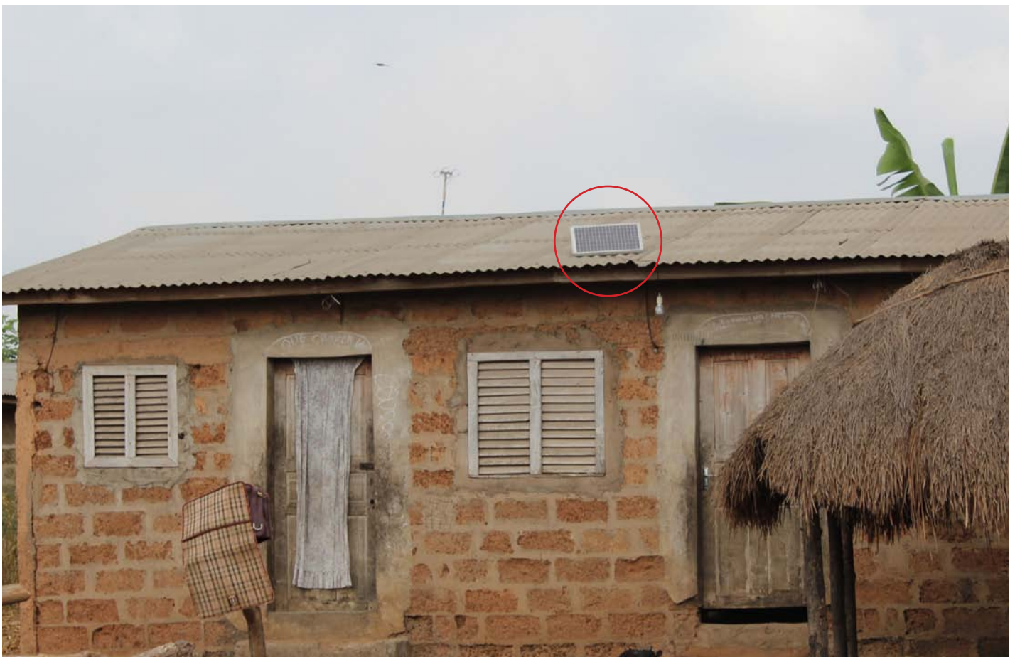
Un panneau solaire installé sur le toit d'une maison

rassure que le remboursement des premiers bénéficiaires permettra de progressif des frais d'installations par financer d'autres ménages.