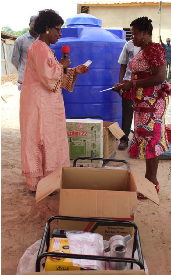
La Représentante Résidente a.i. du PNUD remettant l'attestation de fin d'incubation à une bénéficiaire

Marcel de Souza, beaucoup de défis restent à relever en matière de lutte contre le chômage et le sous emploi des jeunes. Par ailleurs, à peine 20% des terres arables sont valorisées au Bénin. « C'est pour faire du Bénin une puissance agricole que le PPEA a été initié par le Gouvernement », a-t-il indiqué.