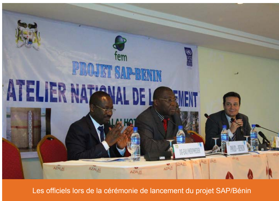
Les officiels lors de la cérémonie de lancement du projet SAP/Bénin

Une composante du projet portera sur l'amélioration de la surveillance météorologique, la veille climatique et environnementale. Une deuxième composante servira à renforcer/développer les systèmes nationaux de prévision afin qu'ils puissent produire des lots d'alerte précoce basés sur les besoins des utilisateurs et diffuser efficacement les alertes et autres informations et données pertinentes pour faciliter les processus de prise de