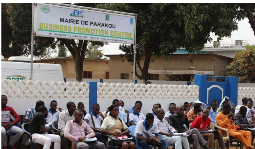
Les jeunes de Parakou venus nombreux assister à l'inauguration du BPC de Parakou

A terme, dix (10) BPC seront opérationnels dans les grandes villes de Cotonou, Porto-Novo, Parakou, Abomey Calavi, Lokossa, Bohicon, Natitingou, Kandi, Pobè et Dassa. Chacun de ces centres développera la stratégie pour devenir autonome d'ici cinq ans.