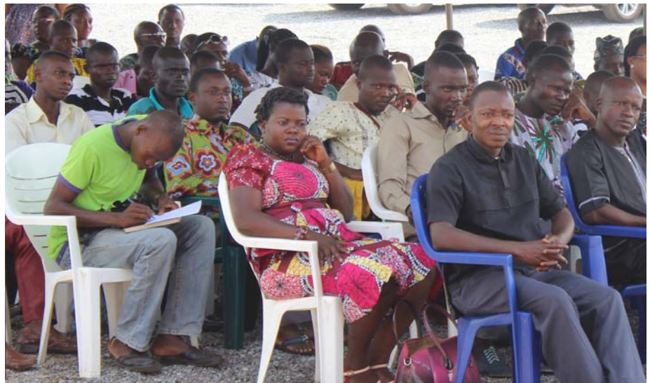
Vue partielle des jeunes gestionnaires de ferme