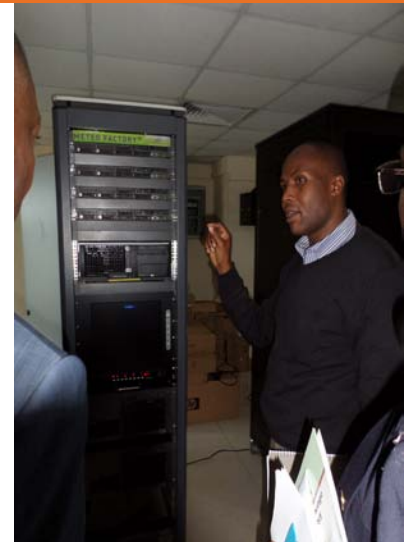
Au centre de prévision du Département météorologique du Kenya (KMD), les experts dudit centre expliquent son fonctionnement à la délégation béninoise