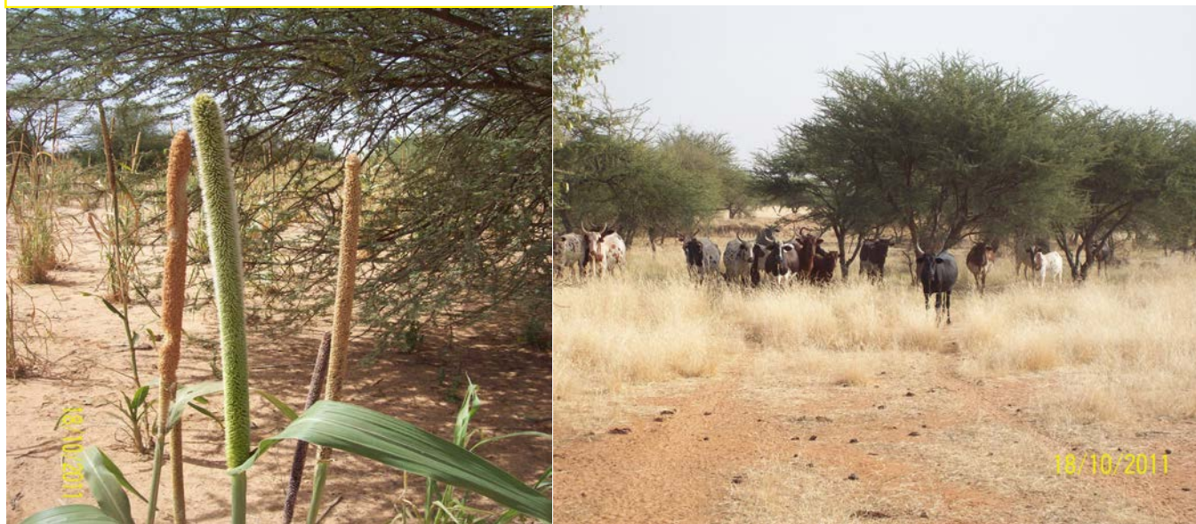
Une fragilité des écosystèmes assez remarquable