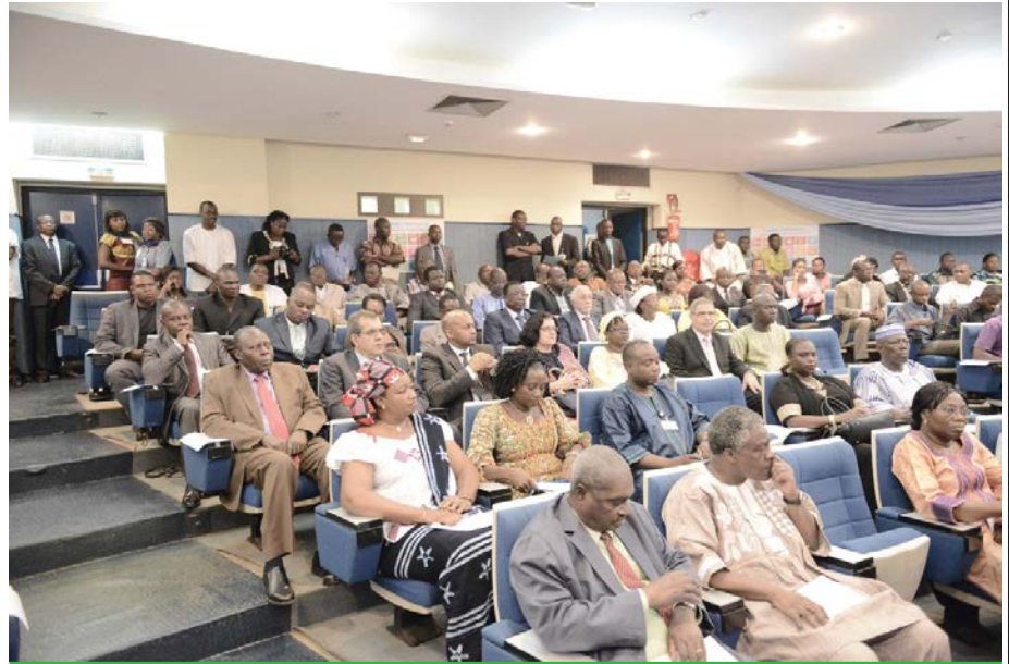
Le personnel du SNU suivant attentivement la présentation sur les ODD

L'avènement des ODD intervient à un moment où les OMD ont montré certaines limites notamment le caractère trop restrictif de leur définition.