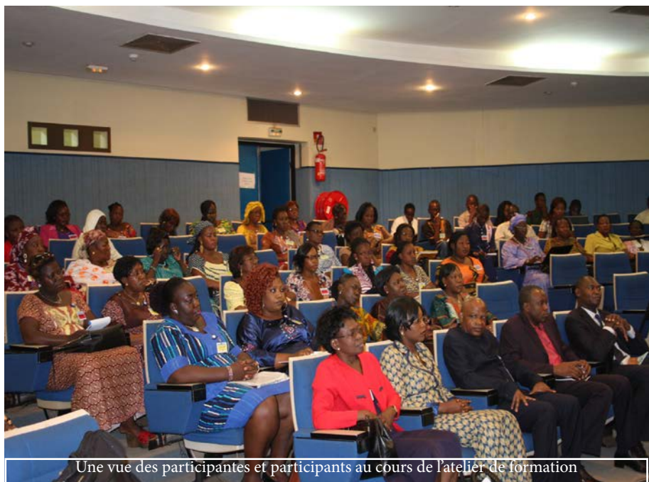
Une vue des participantes et participants au cours de l'atelier de formation

Durant les deux différentes phases, quatre principaux thèmes ont été abordés à savoir : le Développement personnel : Qui suis-je, qui je veux devenir, comment y parvenir... ;