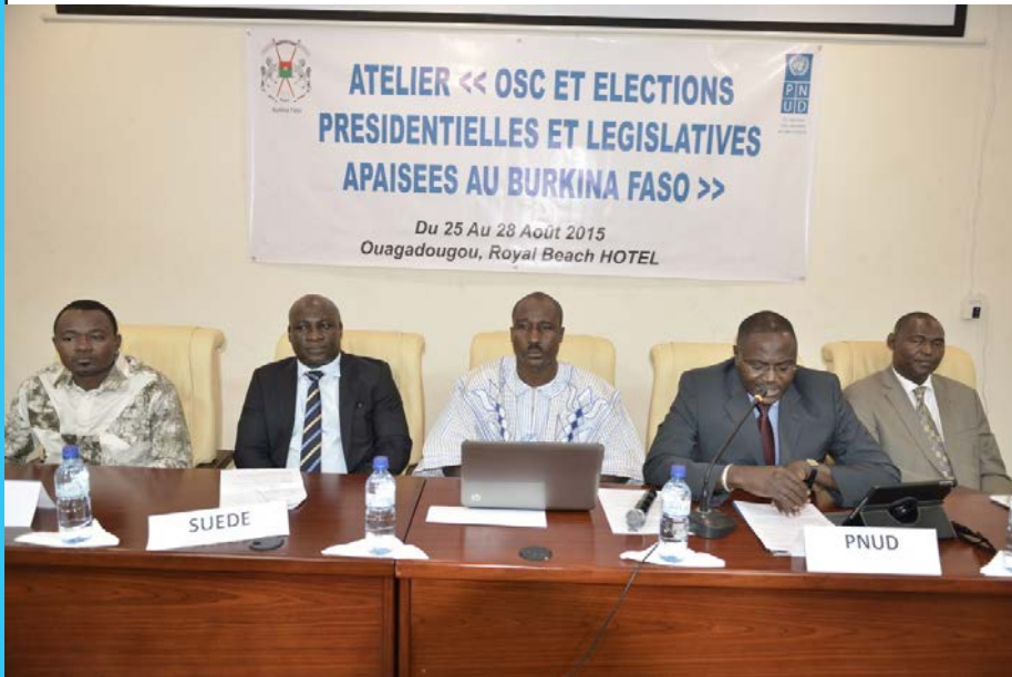
Le présidium au cours de la cérémonie d'ouverture

Dans le souci de contribuer à la tenue des scrutins présidentiel et législatifs apaisés au Burkina Faso, le Programme des Nations Unies pour le Développement (PNUD), à travers son Projet d'appui aux élections au Burkina Faso « PAE-BF 2015-2016 » a organisé, du 25 au 28 Août 2015, au Royal Beach Hôtel de Ouagadougou, un atelier de formation et de planification sur la prévention et la gestion des conflits électoraux en faveur des Organisations de la société civile.