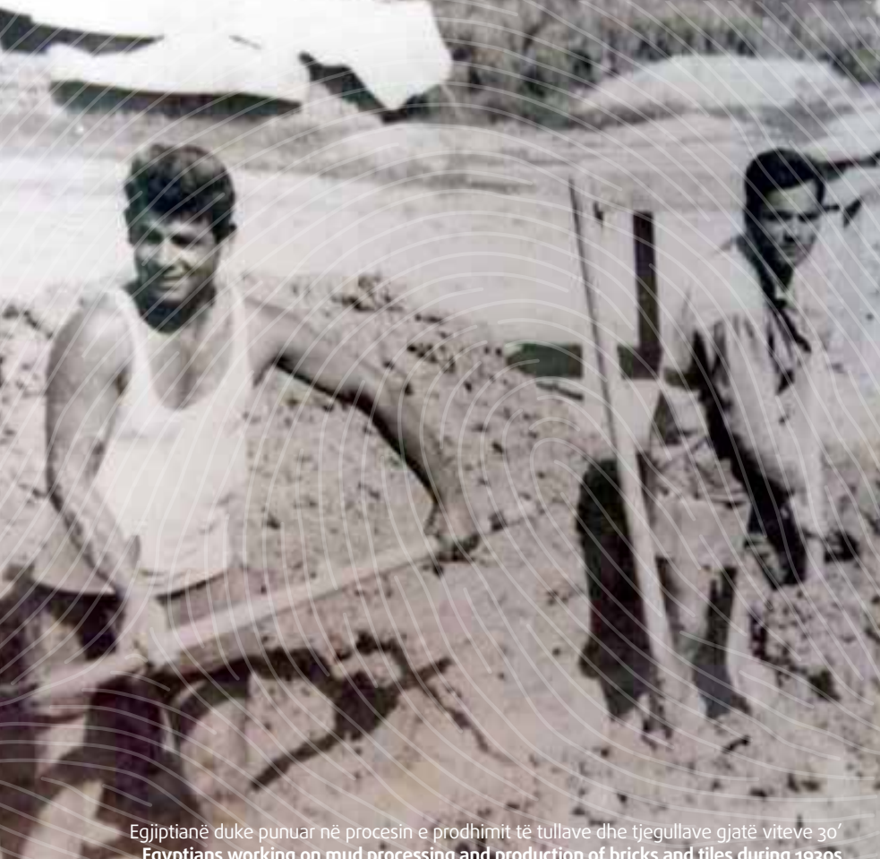
Egjiptianë duke punuar në procesin e prodhimit të tullave dhe tjegullave gjatë viteve 30' Egyptians working on mud processing and production of bricks and tiles during 1930s