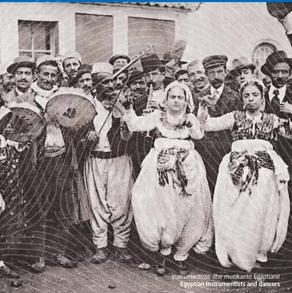
Instrumentistë dhe muzikantë Egjiptianë Egyptian Instrumentists and dancers