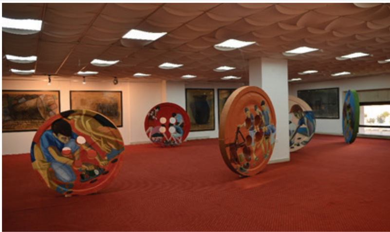
A Roma artist demonstrating his works at the National Art Gallery