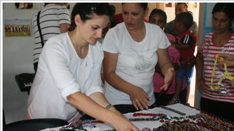
Përmirësimi i aftësive dhe njohurive për tregtimin e punimeve artizanale