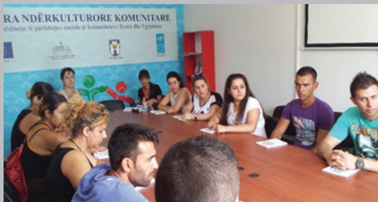
Jekh arakhavipe kaj kerdolpe ando Khetanimasko Maškarkulturako Centro, Berat