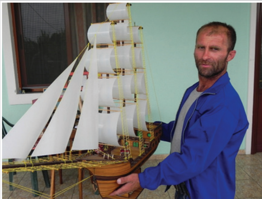
A sailing boat, Such a great souvenir, Berat