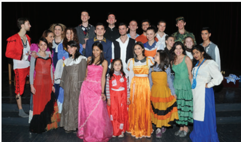
Të rinj romë dhe egjiptianë dhe studentë të Universitetit të Arteve në vënien në skenë të dramës “Të mjerët”