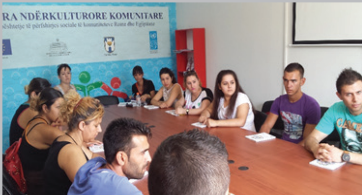
Meeting taking place at the Intercultural Community Center, Berat