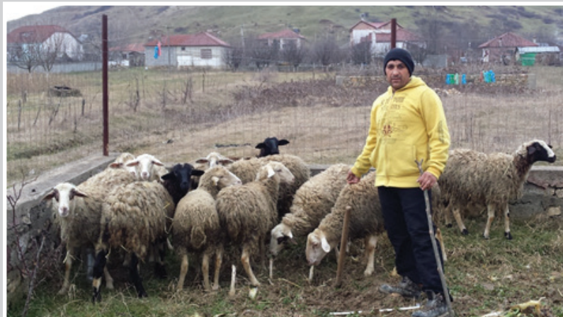
Gjenerimi i të ardhurave nëpërmjet blegtorisë