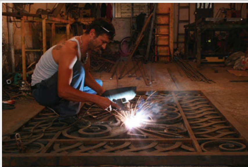
Working on a beautiful iron gate