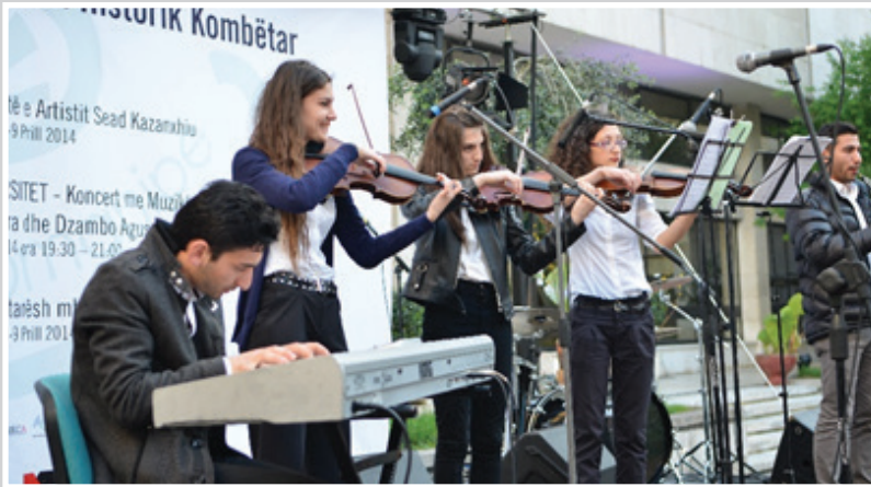
Making music, learning about harmony Albanian and Roma musicians playing together