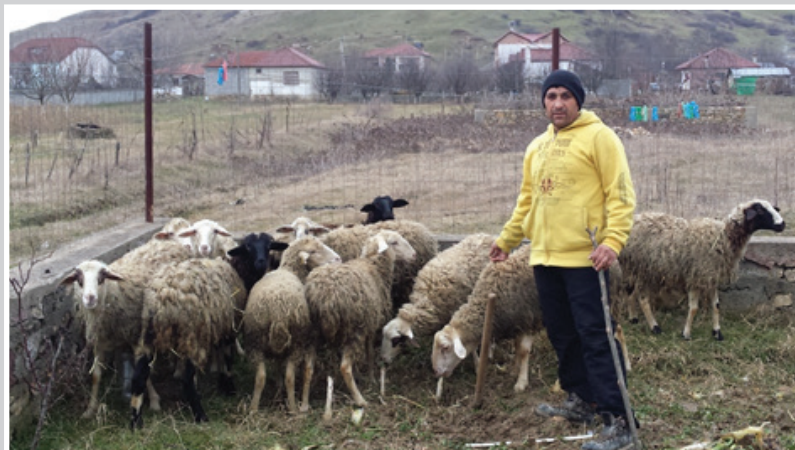
I generaciã e lovengi maškare i blegtoriã