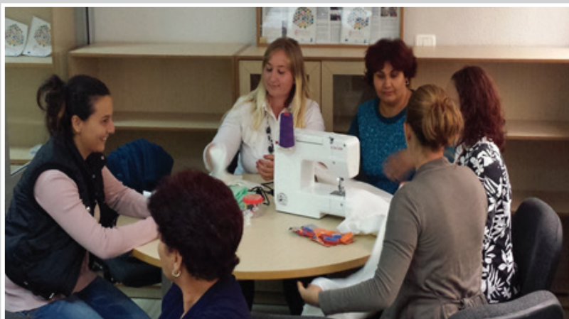
Women learning together how to use the sewing machine in a vocational course