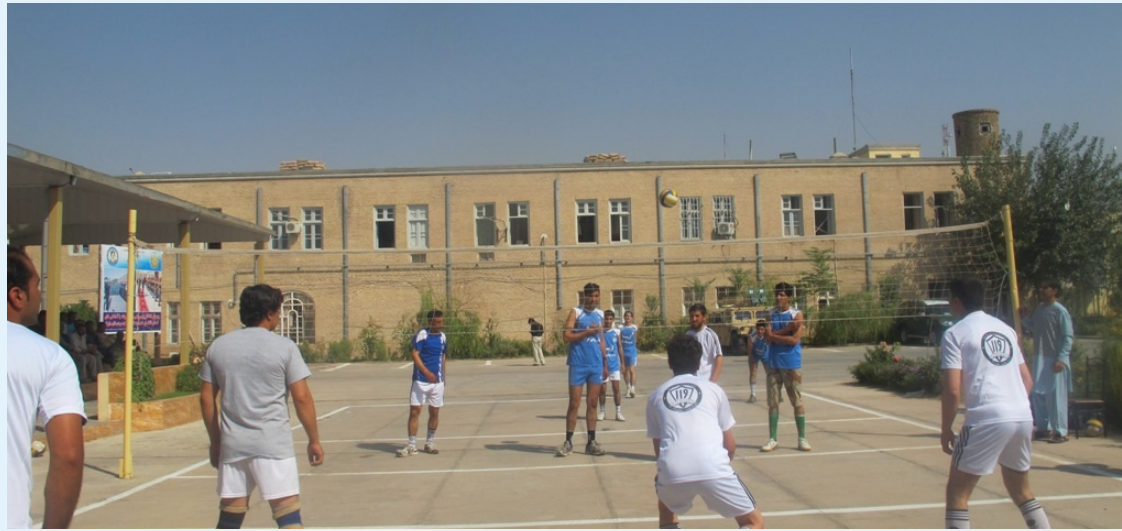
پولیس ملی هنگام بازی والیبال با یک تیم محلی در هرات. بازی های دوستانه ورزشی مردم و پولیس را با هم نزدیک می کند.

ما در داخل شهر گزیه می نمایم، من بینم که مردم چقدر با پولیس همکاری شده اند. یاد دارم که در اکثر اوقات، مردم مشکلات و شکایات خود را زمانیکه ما با آنها در میدان های بازی ملاقات می نمایم، با ما شریک می سازند. من تازه متوجه شده ام که بدون کمک مردم، ما امنیت را تأمین کرده نمی توانیم."