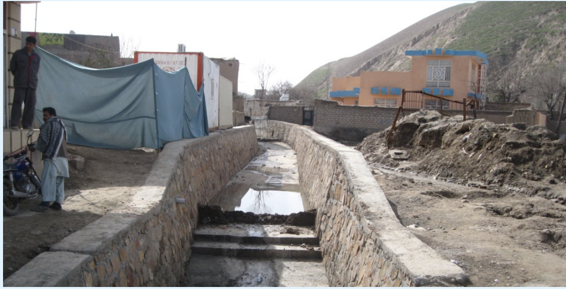
این کانال بازسازی شده شهر قلعه نو ولایت بادغیس را در فصل بهار از تهدید سیلاب ها مصون خواهد کرد.

به محل کار از قریه ها تا به شهر و در درون شهر سریعتر شده و از رنج و درد سر زیادی که در این زمینه وجود داشت کاسته شده است. حالا شرایط تغییر نموده است. بیشتر از ۲۰ پل کوچک در امتداد کانال وجود دارد که برای مردم و موترها زمینه را برای عبور مصئون در شهر مساعد می سازد.