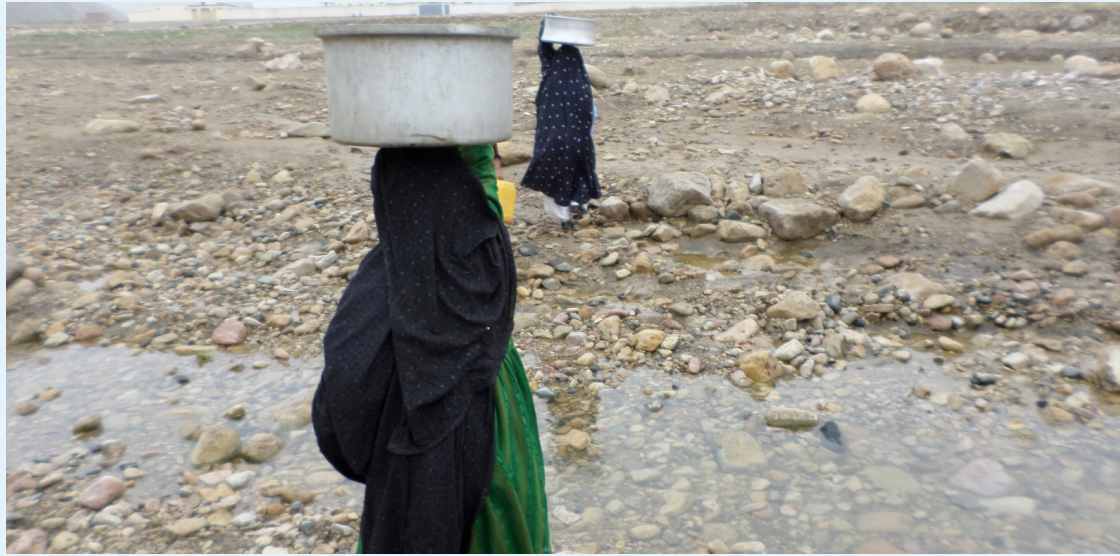
زنی در یک روستای ولایت بادغیس هنگام انتقال آب از نزدیکترین منبع آب.

بخش های ۲۰ گانه آب که با یک لوله مجهز است و از هر یک این نل ها یک بخش از خانه های قریه مستفید میشوند و اینگونه دسترسی آسان بیشتر از ۴۰۰ خانواده را به آب آشامیدنی در سراسر قریه، تامین می نماید.