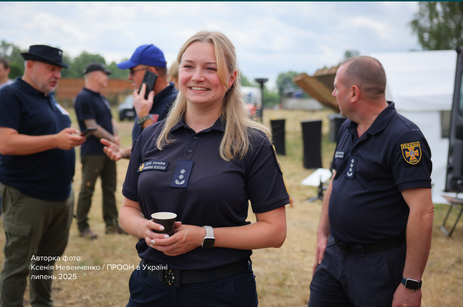
липень 2025