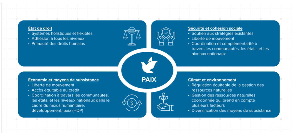
Diagramme 2 : Sources de résilience