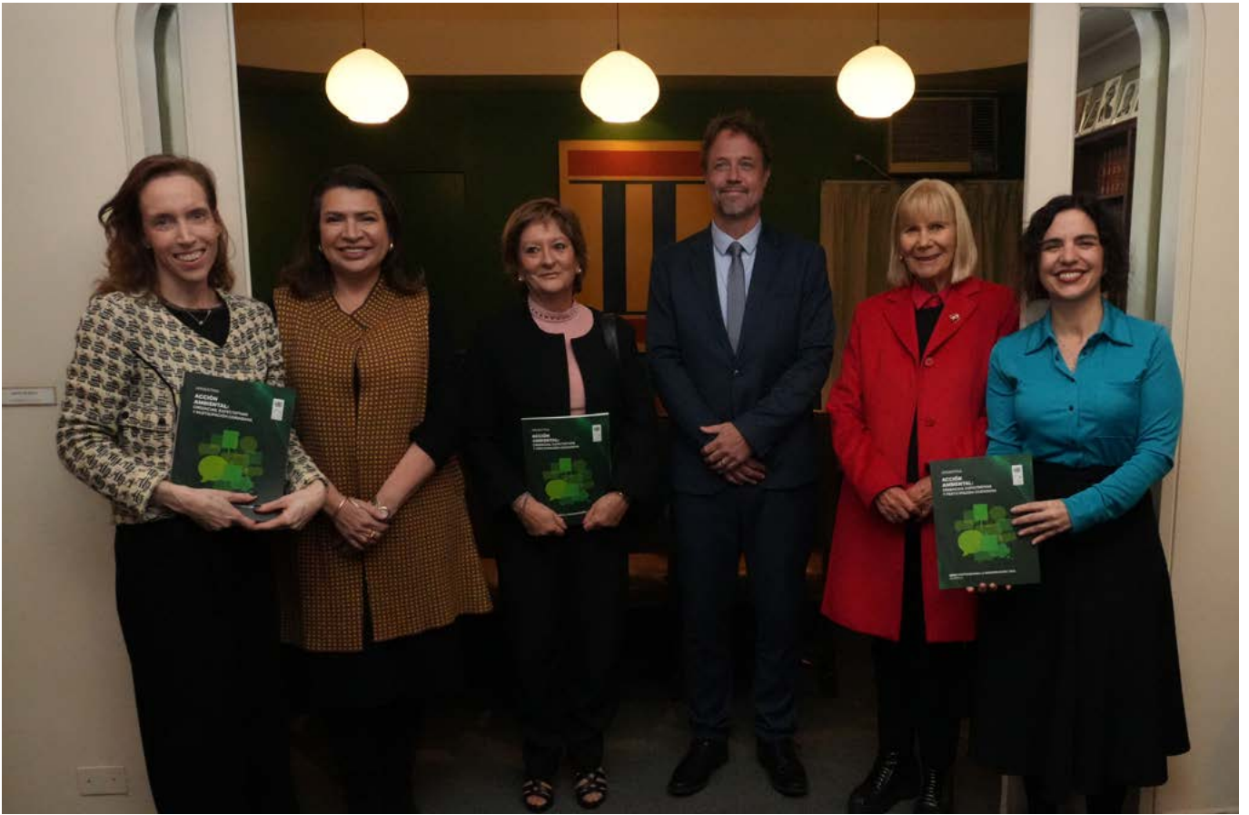
Presentación del informe Acción Ambiental en el CARI.