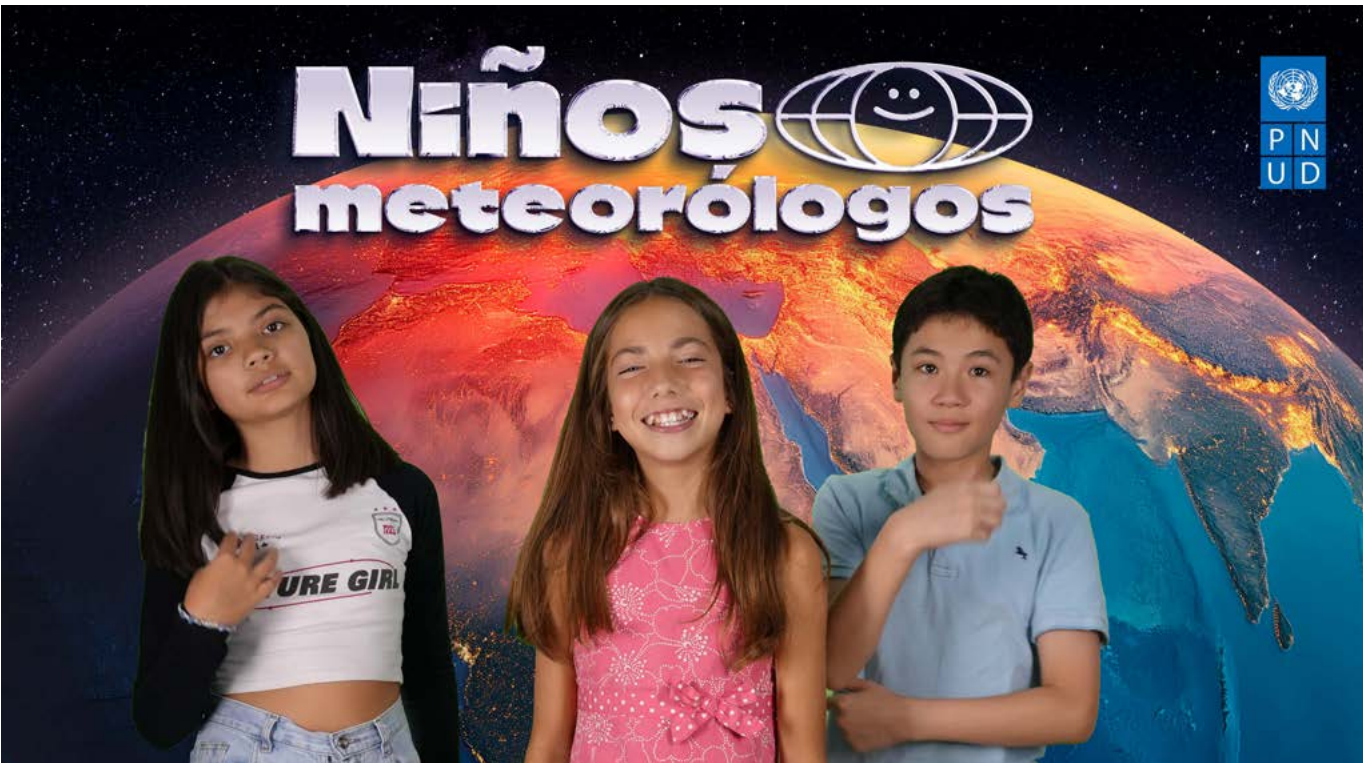
Adaptación de la campaña global del PNUD "Weather Kids".