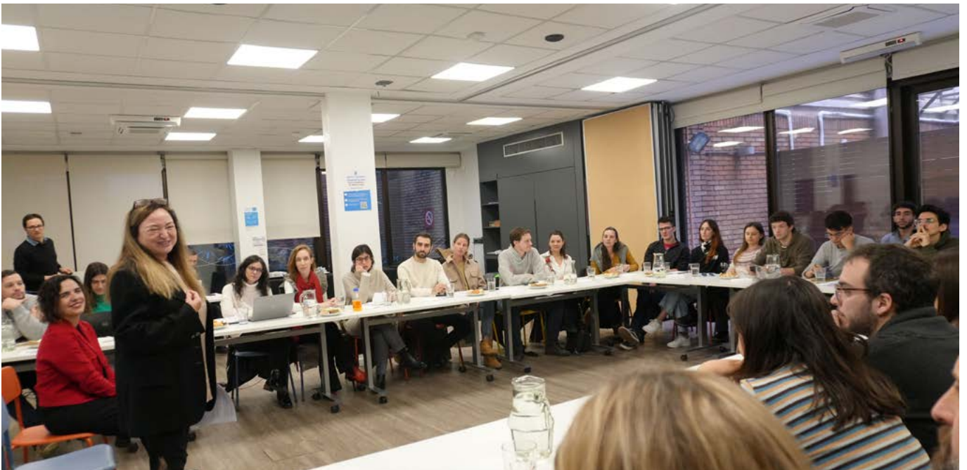
Taller participativo con jóvenes sobre la temática de ambiente.