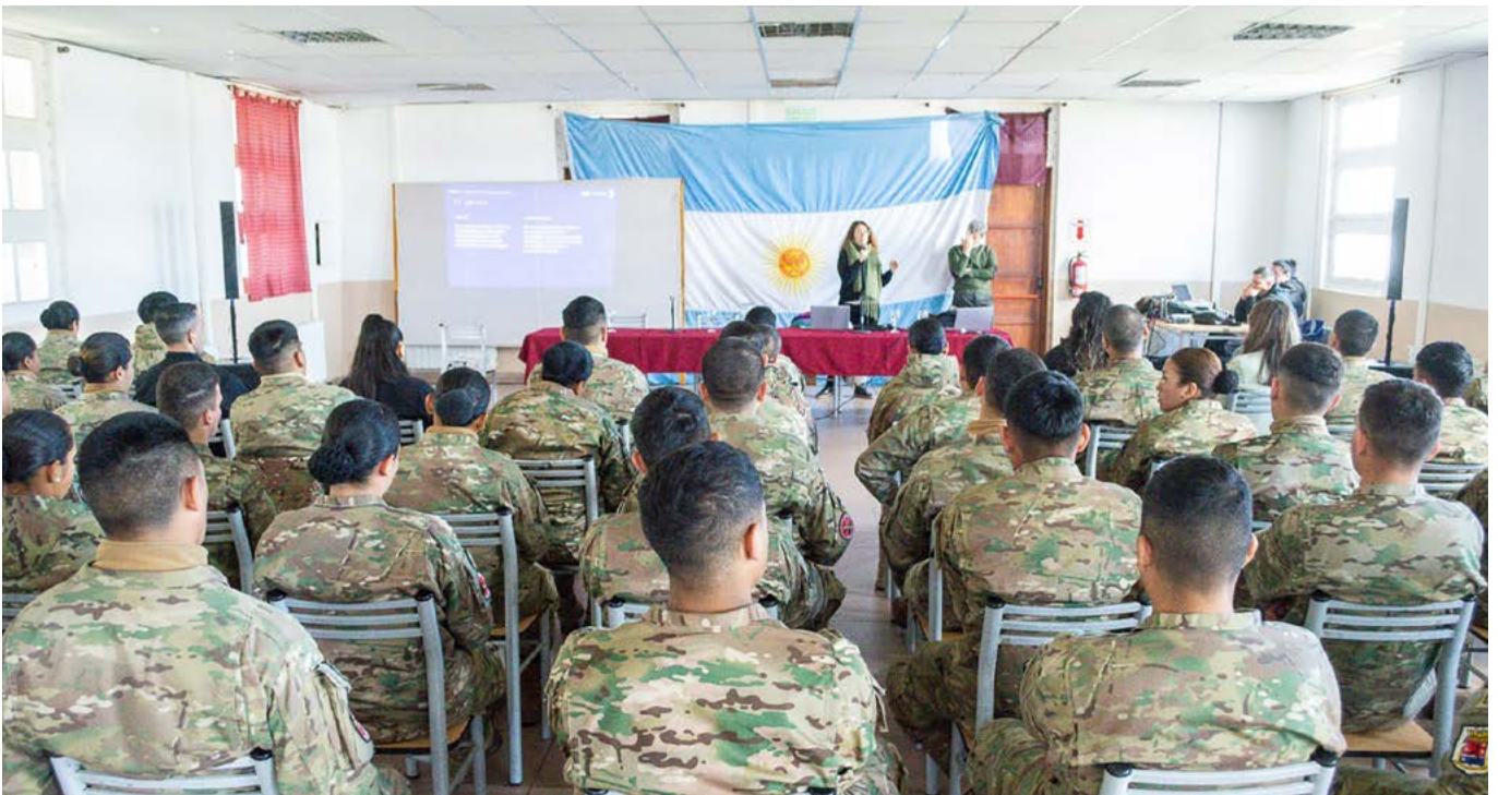
Capacitación a las fuerzas de defensa y seguridad en Río Grande, Tierra del Fuego.