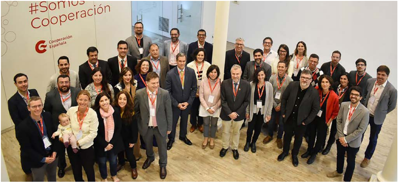
Participación del Foro de Innovación Orientada por Misión en el Cono Sur organizada conjuntamente entre PNUD Uruguay y la Agencia Española de Cooperación Internacional para el Desarrollo (AECID).