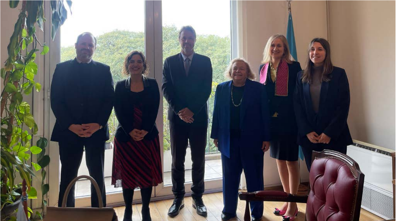
Firma del Acuerdo Marco entre el PNUD y la Defensoría General de la Nación.