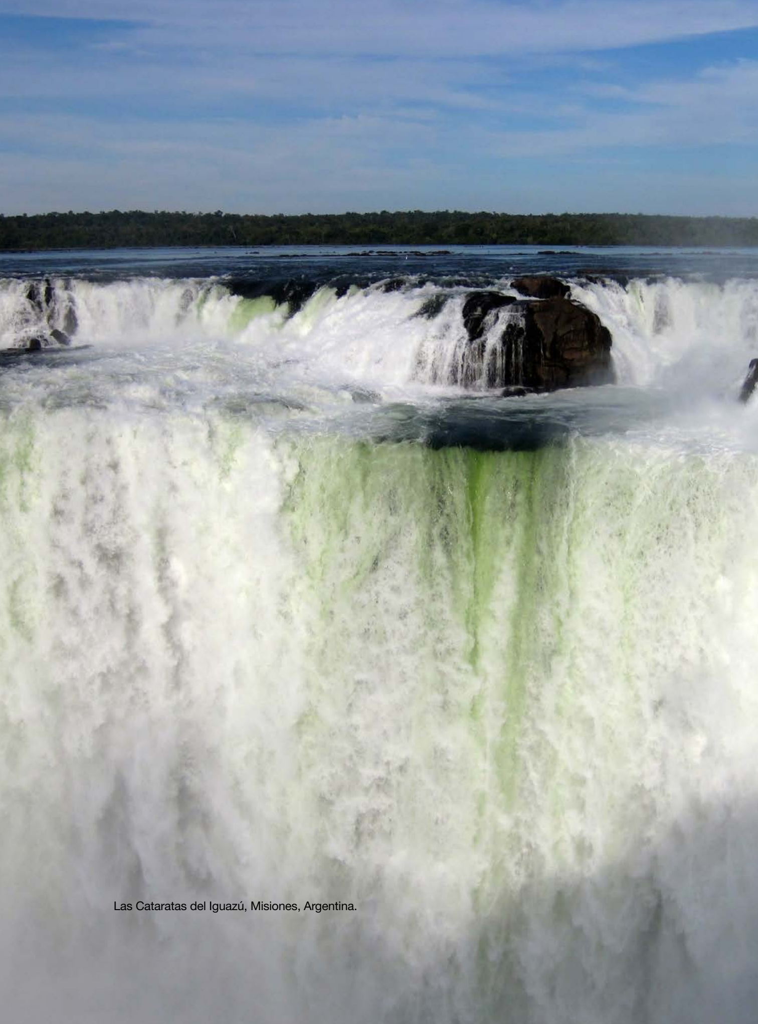
Las Cataratas del Iguazú, Misiones, Argentina.