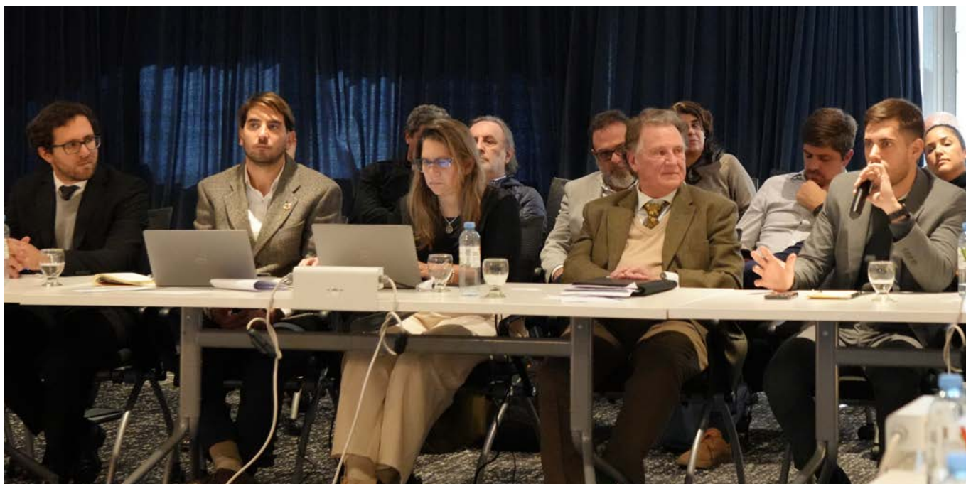
Diálogo de Finanzas para el Desarrollo, un evento que convocó el PNUD junto a distintos actores vinculados a soluciones financieras sostenibles