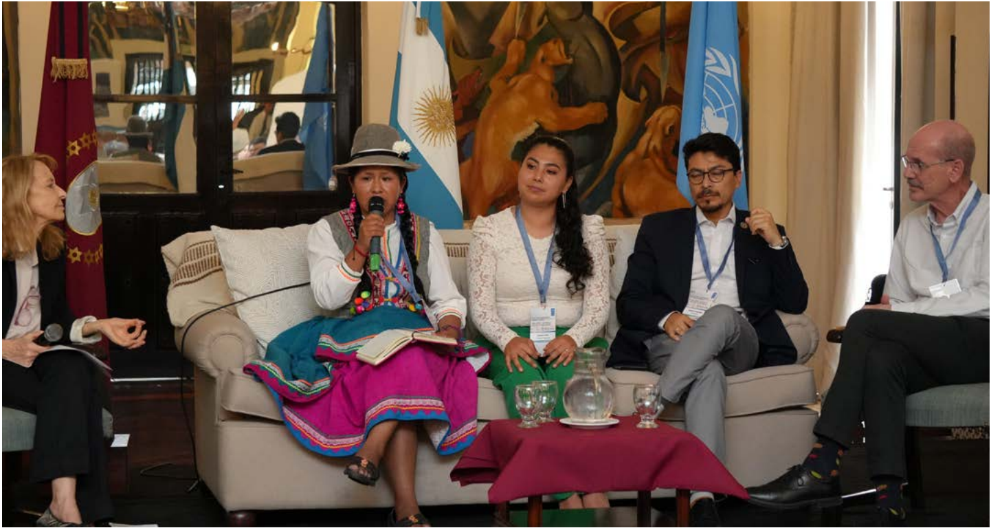
III Reunión Trinacional "Triángulo del Lito" en Salta.