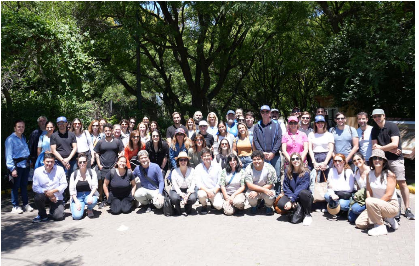
El equipo del PNUD Argentina en la Reserva Ecológica Costanera Sur de la Ciudad de Buenos Aires.