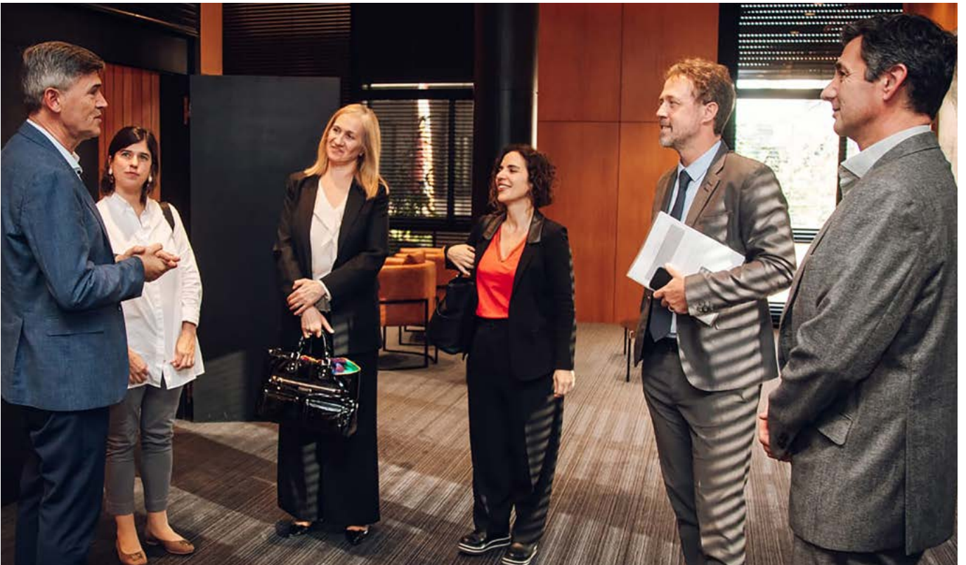
Reunión con el Intendente de la Ciudad de Córdoba Daniel Passerini.