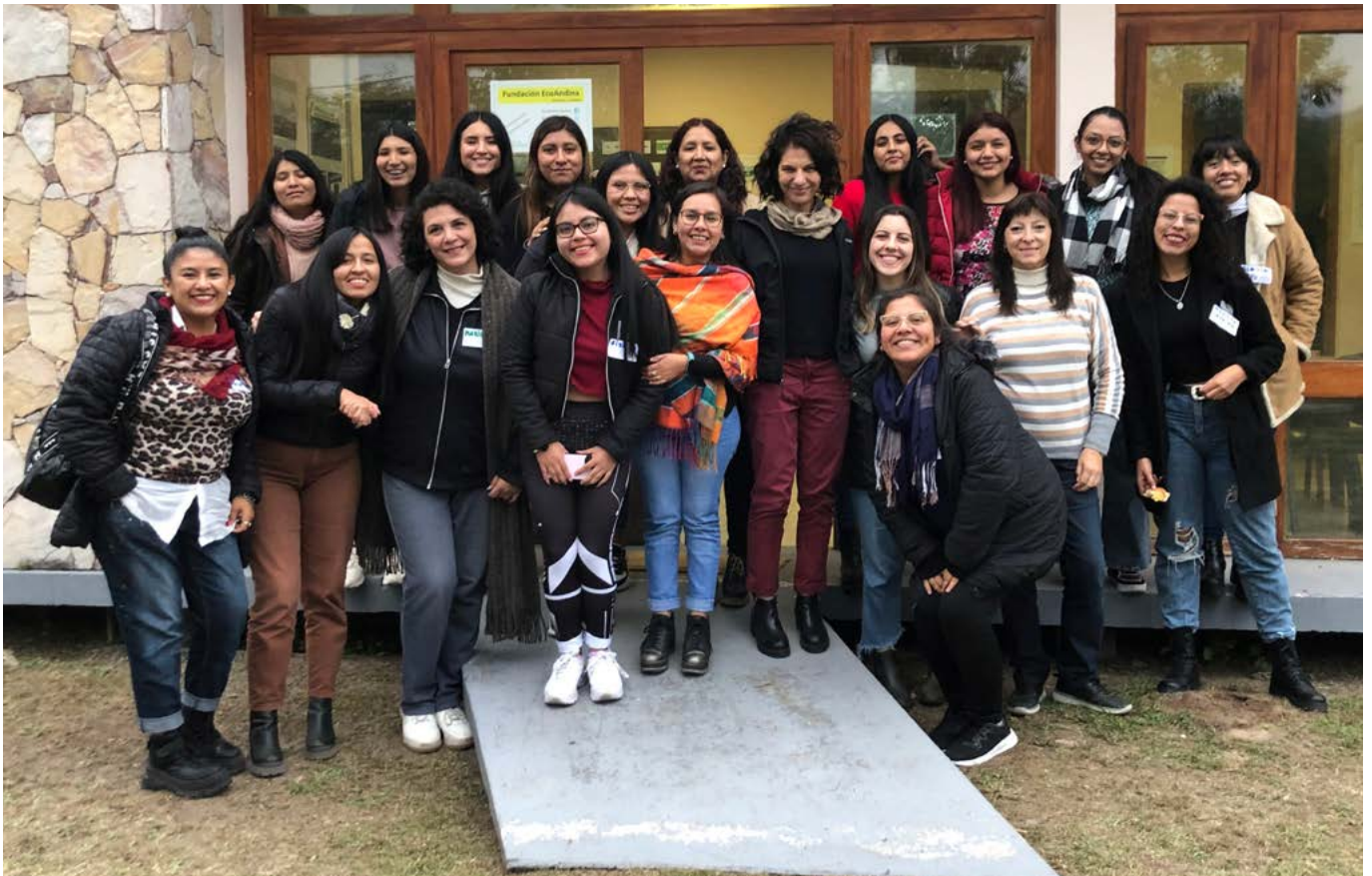
Visita a la provincia de Jujuy para conocer los resultados de la colocación de termotanques solares en 4000 viviendas, que se realizó entre 2016 y 2017.