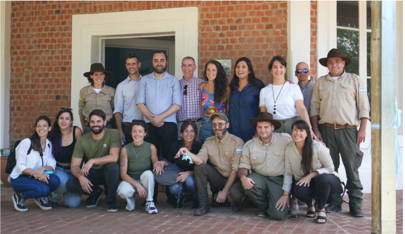
En 2024 PNUD participó de la puesta en valor de la casa de Rubén Darío en la Isla Martín García.