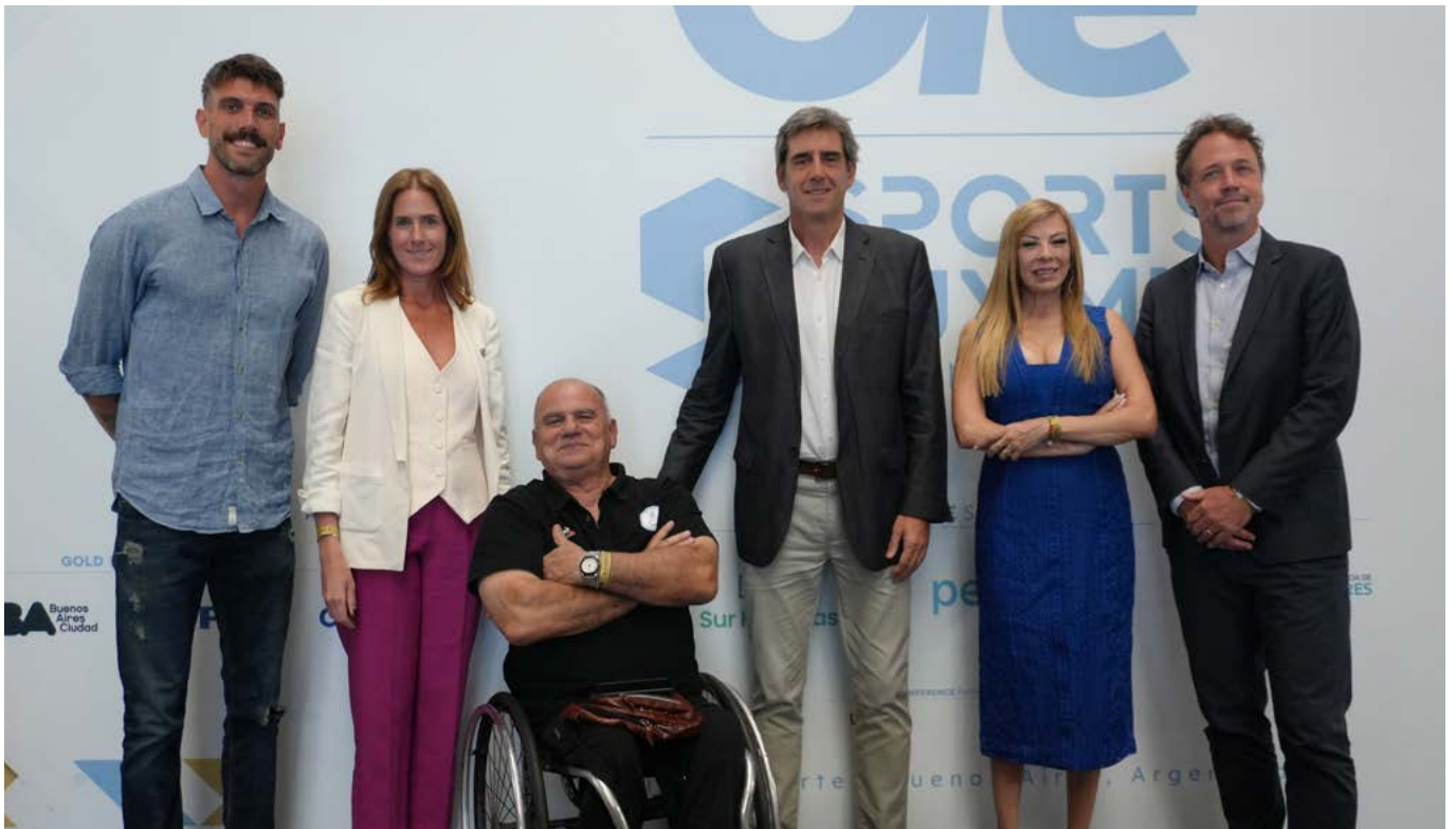
Participación en el Sport Summit 2024.