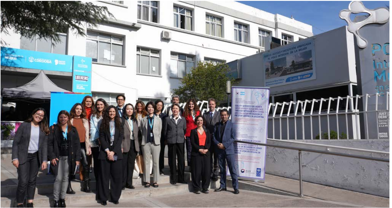
Visita al Polo de la Mujer en Córdoba.