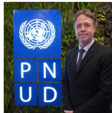
Claudio Tomasi Representante Residente del PNUD Argentina

Esperamos que este informe sea una herramienta útil para conocer en detalle nuestro trabajo y que inaugure una tradición que se fortalecerá año a año, reafirmando nuestro compromiso con el futuro del desarrollo.