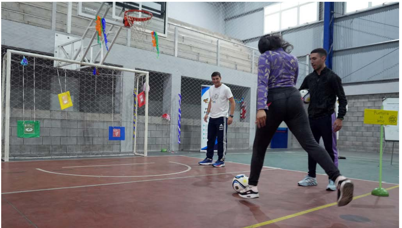
El PNUD estuvo presente en un encuentro de la Fundación Pupi de Javier Zanetti.