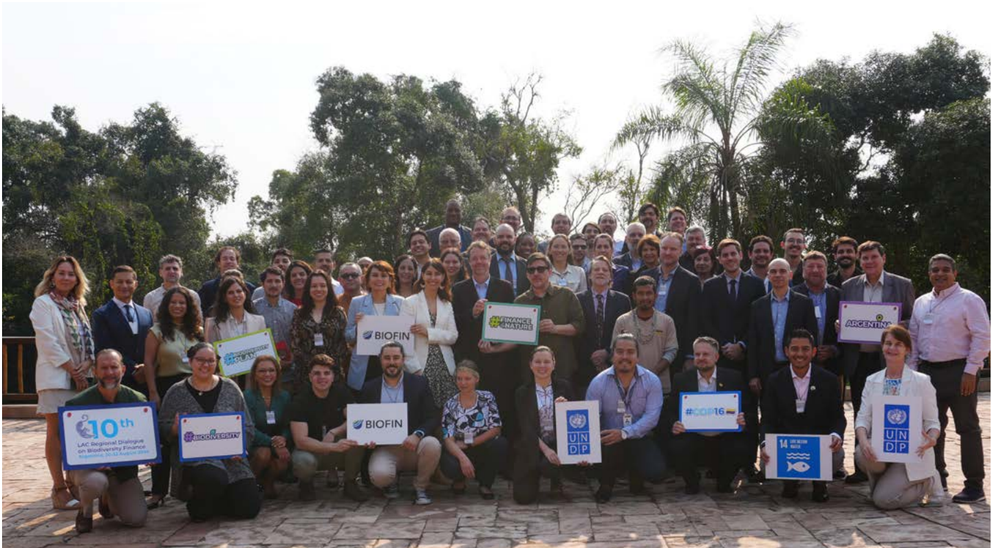
El Encuentro Regional de Biofin en Iguazú, Misiones.