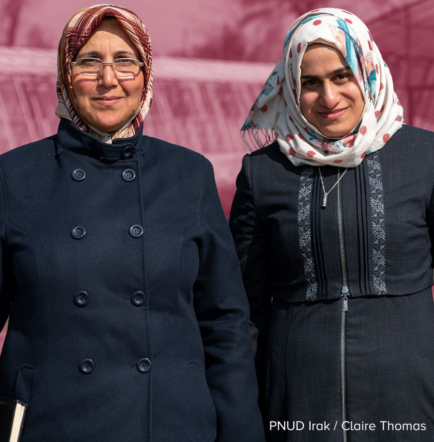
PNUD Irak / Claire Thomas