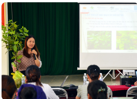
Kỹ thuật thu hái và phơi sấy lá Sói rừng