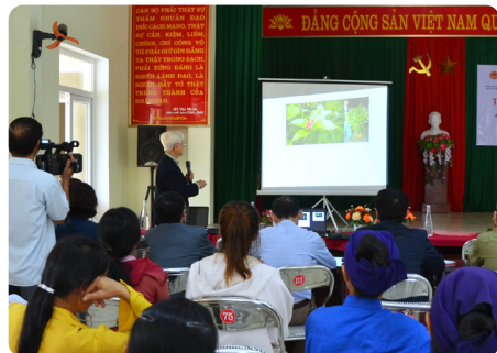
Sói rừng - cây thuốc quý