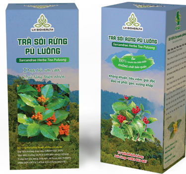
Hộp trà Sói rừng của dự án

Sản phẩm trà Sói rừng được giới thiệu tại lễ hội