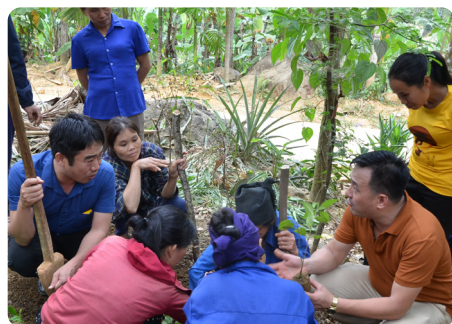
Kỹ thuật trồng cây Sói rừng ở vườn rừng và vườn nhà