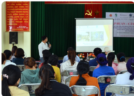
Cây giống gốc và kỹ thuật nhân giống cây Sói rừng