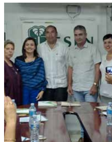
Firma del Acuerdo colaborativo entre la Agencia de Medio Ambiente, la Empresa de Seguros Nacionales y el Programa en Apoyo a la lucha contra la Desertificación y la Sequía (CPP OP 15).