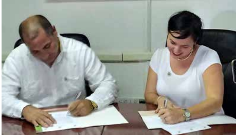
Firma del Plan de trabajo conjunto entre el Programa CPP OP 15 y la Empresa de Seguros Nacionales.

Entre las otras acciones identificadas a desarrollar por las partes involucradas en el acuerdo colaborativo está la capacitación y divulgación de los seguros existentes para el sector agropecuario y forestal, así como conformar materiales para apoyar la difusión de estos seguros. Para poder llevar a cabo estas acciones se firmó un plan de trabajo de junto y a partir del mismo se conformó un cronograma de trabajo.