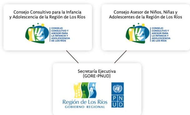
Gráfico 2. Sistema de gobernanza del proceso de construcción colaborativa de la propuesta de Plan de Acción