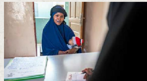
Una mujer denuncia un delito en la comisaría de policía que es apoyada por el PNUD en Qardho, Puntlandia, Somalia.

El Centro de Políticas de Seúl del PNUD, en colaboración con el equipo del PNUD de Estado de Derecho, Seguridad y Derechos Humanos, apoyó a los países socios en la lucha contra la violencia de género. Un total de 7 países utilizaron el mecanismo para sobrevivientes de violencia basado en derechos y el programa de fortalecimiento de capacidad policial de la República de Corea , gracias a la colaboración con la Agencia Nacional de la Policía de Corea y el centro Sunflower , el mecanismo de servicio integral de Corea que proporciona asesoramiento, apoyo psicológico, médico, de investigación y legal a sobrevivientes de violencia de género.