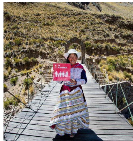
"Prosperar bajo el sol".