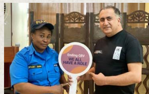
Taller en terreno para la creación de capacidades, destinado a encargados de recabar pruebas jurídicas en casos de violencia de género y a la Policía que participa en el apoyo multisectorial en estos casos, provincia de Kivu del Sur, República Democrática del Congo.