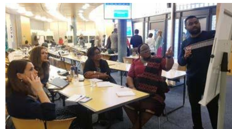
Taller sobre la promoción del acceso a la justicia y la asistencia jurídica en situaciones de desplazamiento forzado, que organizó el PNUD y el ACNUR.

En la evaluación del apoyo del PNUD al acceso a la justicia , que realizó la Oficina de Evaluación Independiente en 2022, se reconoció el papel del PNUD como un actor clave en la prestación de asistencia para el desarrollo internacional en el sector de la justicia. El PNUD asumió el compromiso de poner en práctica las recomendaciones y el aprendizaje que se desprendieron del proceso de evaluación, incluyendo una mayor promoción de un enfoque de la justicia centrado en las personas.