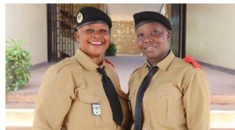
Estudiantes de Magistratura de la Escuela Nacional de Administración y Magistratura de la República Centroafricana.