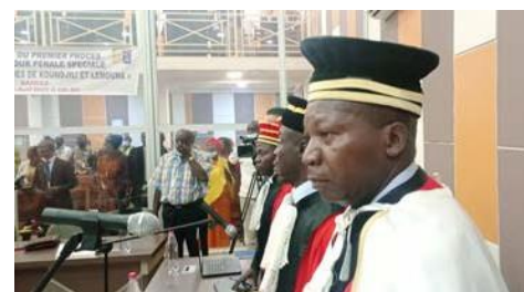
En la República Centroafricana, la lucha contra la impunidad es la prioridad del Programa Conjunto sobre el Estado de Derecho. El Tribunal Penal Especial pronunció su primer veredicto en 2022.

En 2022, el GFP aportó fondos dinamizadores y recursos técnicos para la programación conjunta del Estado de derecho en la República Centroafricana, la República Democrática del Congo, Haití, Libia, Malí, Níger, Somalia y Sudán.