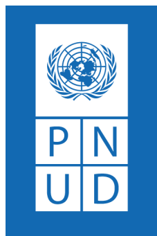
Versión en blanco para utilizar en fondos oscuros.