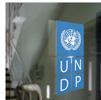
Calcomanía de vinilo