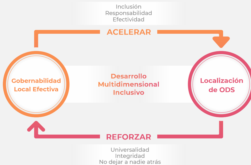
Figura 1. Círculo virtuoso de la localización de ODS y la GLE

Esta estrategia propone que la GLE y la localización de ODS integran un círculo virtuoso, en el que se aceleran y refuerzan mutuamente. La GLE tiene la potencialidad de acelerar los procesos de localización de Objetivos de Desarrollo Sostenible (ODS) y garantizar que estos sean adaptados e implementados de manera efectiva en el territorio. Simultáneamente, los planes, programas y acciones orientadas al logro de los ODS a nivel territorial traccionan y refuerzan el ejercicio de la GLE , involucrando a todos los actores presentes en el territorio.