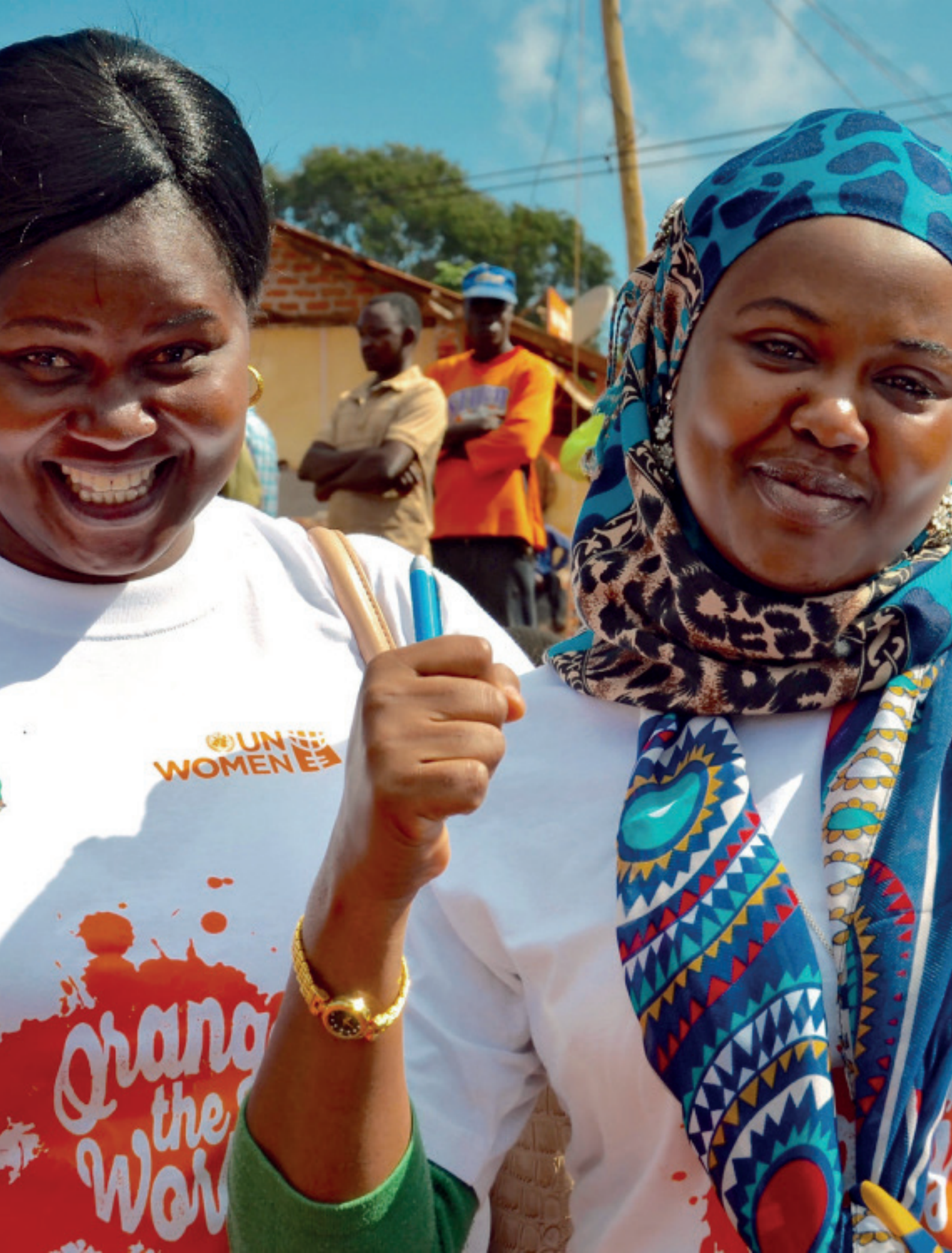
Campaña "Orange de World" (Pinta el mundo de naranja) en Tanzania.