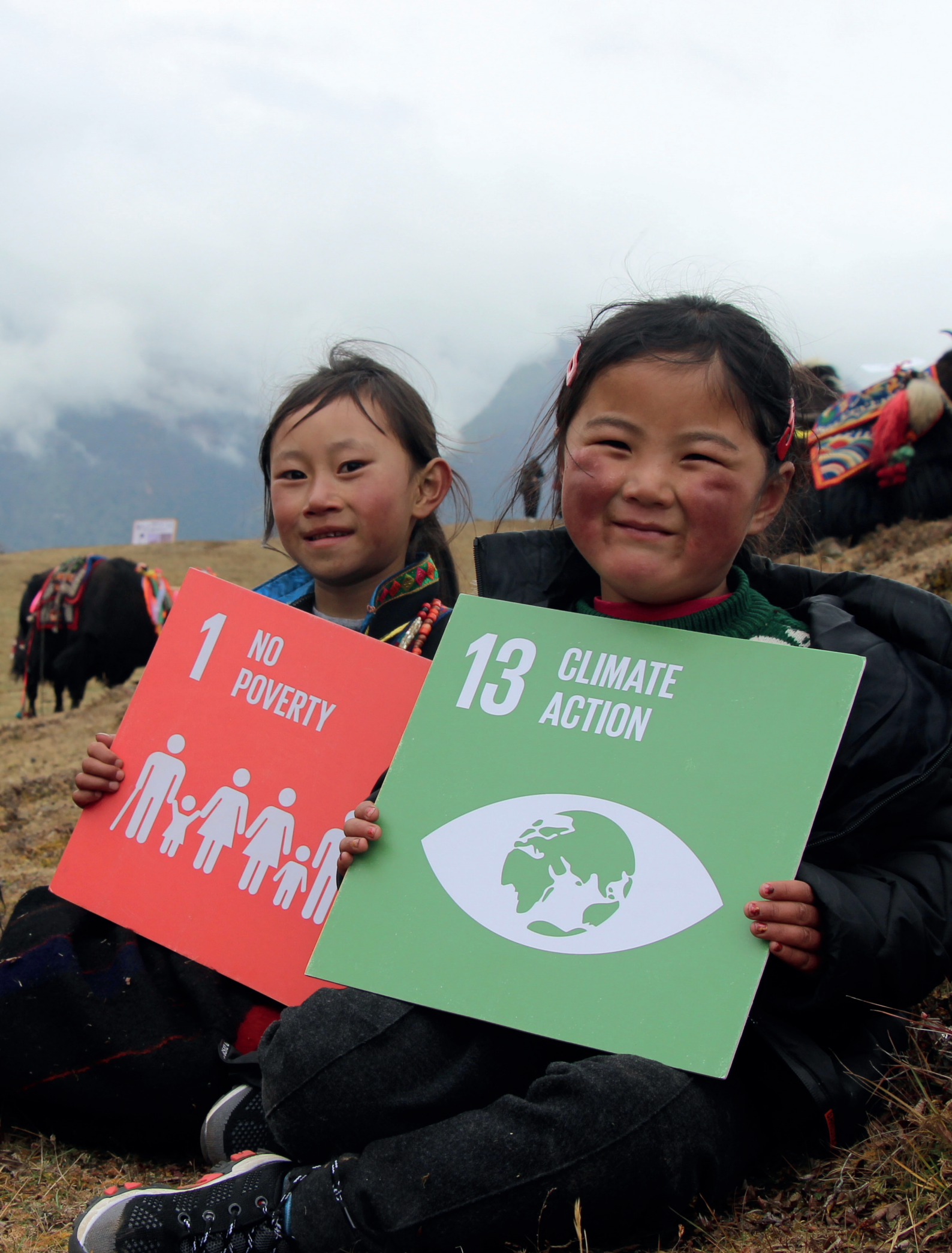
Niños con iconos de los ODS en Bután.