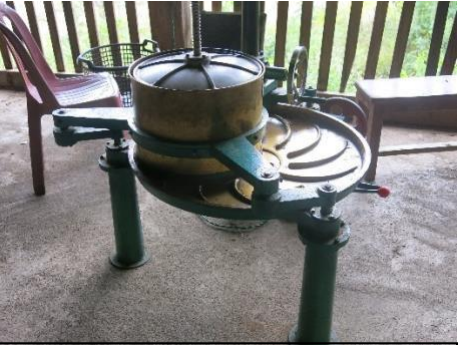
ເຄື່ອງເຮັດຊາໃນ ບ້ານຍອດພຽງ, ເມືອງແປກ

ໃນທຸກບ້ານທີ່ໄດ້ໄປຍັງມຸຍາມ, ການຜະລິດພືດເສດຖະກິດ, ເຊັ່ນ: ມັນຕົ້ນ, ຖົ່ວ, ສາລີຫວານ, ແລະ ຊາ, ໄດ້ຊ່ວຍໃຫ້ປະຊາຊົນສາມາດຍົກສູງຊີວິດການເປັນຢູ່ ແລະ ຫັນປ່ຽນອອກຈາກການກະສິກຳເພື່ອລ້ຽງຊີບແບບເດີມ ຍ້ອນພືດພັນໃໝ່ເຫຼົ່ານີ້ ແມ່ນສາມາດປູກໄດ້ທຸກລະດູການໃນຕະຫຼອດທັງປີ. ຍົກຕົວຢ່າງ, ໃນບ້ານລອງປິວ, ລູກບ້ານໄດ້ກ່າວວ່າ ການຫັນມາໃຊ້ປູ່ຍ ແລະ ການປູກເຂົ້າສາຍພັນໃໝ່, ເຂົ້າໄກ່ນ້ອຍ, ໄດ້ເຮັດໃຫ້ພວກເຂົາຫັນເຖິງຄວາມແຕກຕ່າງດ້ານການຜະລິດ. ກ່ອນໜ້ານີ້ຜະລິດເຂົ້າໄດ້ພຽງແຕ່ 30 ເປົາຕໍ່ເຮັກຕ້າ, ແຕ່ດຽວນີ້ສາມາດຜະລິດໄດ້ 70 ເປົາແລ້ວ. ເຖິງແມ່ນວ່າວຽກງານເກັບກູ້ ລບຕ ຈະບໍ່ແມ່ນປັດໄຈໂດຍກົງ ທີ່ປະກອບສ່ວນຕໍ່ຄວາມປ່ຽນແປງດັ່ງກ່າວກໍ່ຕາມ, ການເພີ່ມຂຶ້ນຂອງລາຍຮັບກໍ່ໄດ້ຊ່ວຍໃຫ້ປະຊາຊົນ ສາມາດຊື້ຊັບສິນໄດ້ຫຼາຍຂຶ້ນ, ສ້າງເຮືອນທີ່ແທດ້ວຍປູນແໜ້ນໜາ, ແລະ ສາມາດສົ່ງລູກຮຽນໄດ້ສູງຂຶ້ນ ທັງຍັງມີເງິນເກັບນຳອີກ.