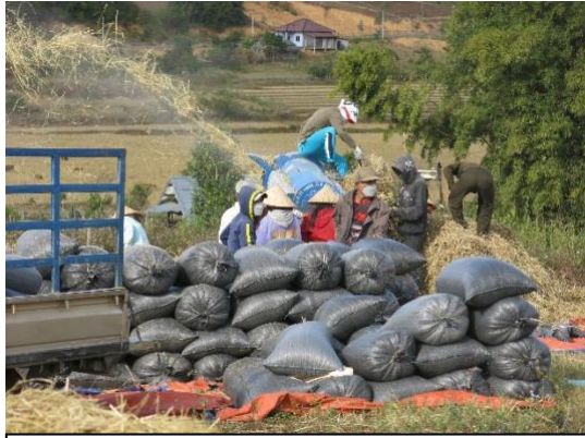
ການເກັບກຽວເຂົ້າຢູ່ບ້ານລາດບວກ, ເມືອງແປກ

ລູກບ້ານບາງຄົນໄດ້ລາຍງານວ່າ ພວກເຂົາໄດ້ມີການປັບປຸງແກ້ໄຂເຕັກນິກການປູກຝັງຂອງຕົນ ຫຼັງການເກັບກູ້ລະເບີດ, ເຖິງແມ່ນວ່າຈະເປັນການປັບປຸງແບບເລັກນ້ອຍກໍ່ຕາມ. ກ່ອນການເກັບກູ້ ລບຕ, ປະຊາຊົນມັກເວົ້າວ່າ ພວກເຂົາຕ້ອງໄດ້ເຮັດວຽກຢ່າງຊ້າໆ ແລະ ລະມັດລະວັງ, ຫຼື ຕ້ອງໄດ້ເປົາມືໃນເວລາຂຸດຂຸມ. ຫຼັງຈາກການເກັບກູ້ແລ້ວ, ປະຊາຊົນໄດ້ລາຍງານວ່າ ພວກເຂົາຮູ້ສຶກໜັ້ນໃຈຫຼາຍຂຶ້ນ ໃນການຂຸດຂຸມ ແລະ ພວນດິນເພື່ອເປັນການປັບປຸງຄຸນນະພາບຂອງດິນ.