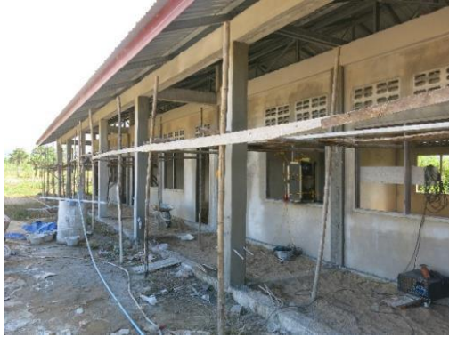
ຫ້ອງຮຽນກຳລັງຖືກສ້າງຂຶ້ນເທິງທີ່ດິນທີ່ໄດ້ຮັບການເກັບກູ້ລະເບີດແລ້ວໃນ ບ້ານທອງແສນ, ແຂວງບໍລິຄຳໄຊ

ການເສີມຂະຫຍາຍໂຮງຮຽນຖືເປັນວຽກງານທີ່ສຳຄັນ ສຳລັບກຸ່ມບ້ານດັ່ງກ່າວ ທີ່ປະກອບມີ 3 ບ້ານຂະໜາດນ້ອຍໂຮມກັນ ແລະ ຕັ້ງຢູ່ໃນ ເຂດສຳຄັນເພື່ອການພັດທະນາ. ດັ່ງນັ້ນຈຶ່ງຄາດໝາຍວ່າ ຈຳນວນປະຊາກອນກໍ່ຈະສືບຕໍ່ເພີ່ມຂຶ້ນເລື້ອຍໆ. ອາຄານຂອງໂຮງຮຽນດັ່ງກ່າວ ຍັງຢູ່ໃນຂັ້ນຕອນການກໍ່ສ້າງໃນເວລາທີ່ລົງຢ້ຽມຢາມລ່າສຸດ.