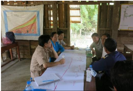
ການກຳນົດແຜນຜັງລຳດັບເວລາໃນບ້ານ ລອງປົວ, ເມືອງຄຳ, ແຂວງຊຽງຂວາງ

FGD ແມ່ນເນັ້ນໜັກໄປທີ່ການສ້າງລຳດັບເວລາ, ເພື່ອນຳໃຊ້ເຂົ້າໃນການສືບຄວາມປ່ຽນແປງ, ທັງໃນທາງບວກ ແລະ ທາງລົບ, ທີ່ເກີດຂຶ້ນໃນບ້ານຕ່າງໆ ໃນຊ່ວງໄລຍະເວລາທີ່ກຳນົດໃດໜຶ່ງ, ໂດຍເປັນເອກະພາບກັນກັບຜູ້ເຂົ້າຮ່ວມ FGD. ຄວາມປ່ຽນແປງທີ່ໂອ້ລົມກັນໃນກຸ່ມ ປະກອບມີຄວາມປ່ຽນແປງດ້ານຜືນຖານໂຄງລ່າງ, ການສຶກສາ, ສຸຂະພາບ, ການກະສິກຳ, ແລະ ການເຂົ້າເຖິງບໍລິການອື່ນໆ, ເຊັ່ນ: ໄຟຟ້າ ແລະ ນໍ້າປະປາ. ຫັນທີທີ່ຄວາມປ່ຽນແປງດັ່ງກ່າວ ຖືກນຳໄປຈັດລຽງເຂົ້າໃນແຜນຜັງລຳດັບເວລາ, ຜູ້ເຂົ້າຮ່ວມການສືບທະນາ ກໍ່ຈະຖືກຖາມວ່າບັນຫາການຕົກຄ້າງຂອງ ລບຕ ມີຜົນກະທົບ ຫຼື ບໍ່ ແລະ ຖ້າມີ, ມີຜົນກະທົບແນວໃດຕໍ່ກັບຄວາມຄືບໜ້າ, ແລະ ວຽກງານການເກັບກູ້ ລບຕ ມີການປະກອບສ່ວນ ຫຼື ບໍ່ ແລະ ຖ້າມີ, ມີການປະກອບສ່ວນແນວໃດຕໍ່ຄວາມປ່ຽນແປງດັ່ງກ່າວ. ດ້ວຍວິທີນີ້, FGD ກໍ່ຈະຊ່ວຍໃຫ້ສາມາດກຳນົດແຜນຜັງລຳດັບເວລາໃຫ້ແກ່ບ້ານໃດໜຶ່ງໄດ້ເປັນເວລາຫຼາຍປີ ຫຼື ຫຼາຍທົດສະຫວັດ ທັງຍັງສາມາດຊີ້ໃຫ້ເຫັນໄດ້ວ່າ ບ່ອນໃດທີ່ວຽກງານເກັບກູ້ລະເບີດ ໄດ້ມີການສະໜັບສະໜູນການພັດທະນາ ແລະ ການປ່ຽນແປງ.