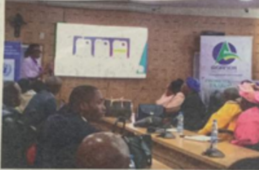
Une vue des échanges au cours de la formation.