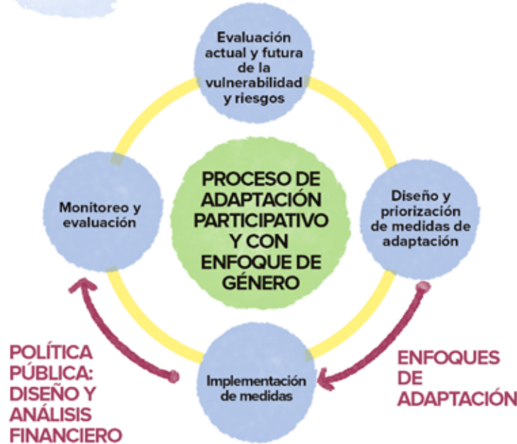
CICLO DEL PROCESO DE ADAPTACIÓN