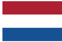
Pays - Bas