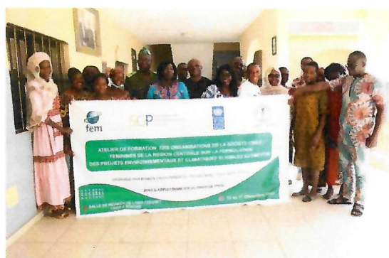
Ateliers régionaux de renforcement des capacités des OSC féminines sur l'élaboration des projets environnementaux et climatiques, éligibles au PMF/FEM