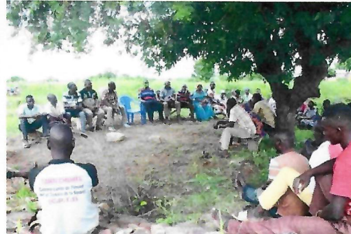
Vue partielle du barrage, après curage et construction de la digue/déversoir et des gabions, et échanges entre quelques bénéficiaires et la délégation du PMF/FEM (CADID, TONE)