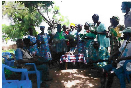
Produits maraichers et transformés présentés par un groupement de femmes et de jeunes sur le site maraicher (ARPODIFE, KOZAH)