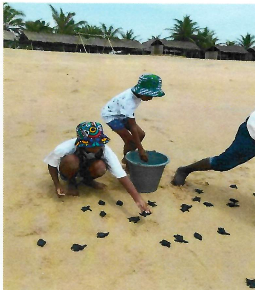
Protection des tortues marines sur le littoral (AGBO ZEGUE, GOLFE)