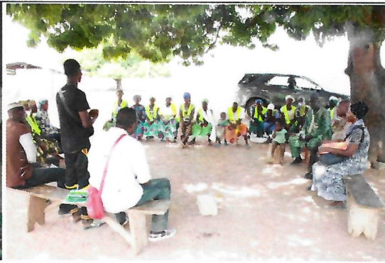
Fosse fumière installée par un bénéficiaire et échanges entre la mission et un groupe de bénéficiaires (GRAIL NT, OTI-SUD)