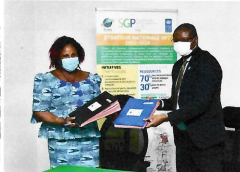
Signature de conventions de financement avec les 9 ONG/OCB du 12 e round de financement du PMF/FEM