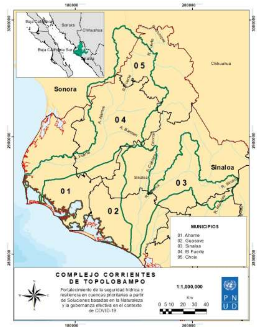
Figura 1. Ubicación del Complejo Corrientes de Topolobampo.

Nota: La zona de implementación debe estar dentro del polígono de las cuencas señaladas.