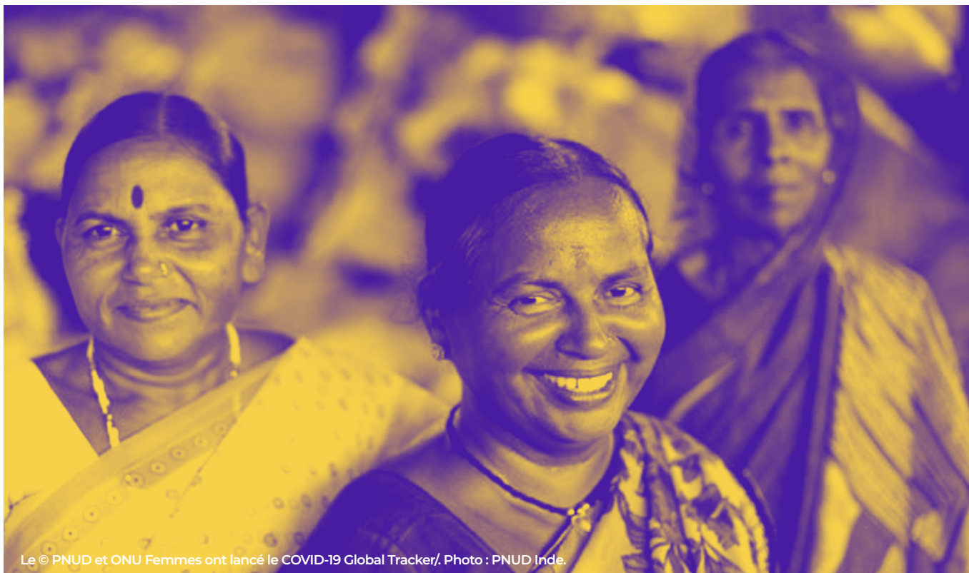
Le © PNUD et ONU Femmes ont lancé le COVID-19 Global Tracker/.

Dans ce contexte, le PNUD est tout à fait capable d'adopter une approche mobilisant l'ensemble de la société et d'aider les gouvernements à multiplier les choix de développement national qui fonctionnent pour tous. Au cours des 56 dernières années, le PNUD a su gagner en crédibilité et susciter la confiance. Sa présence dans 170 territoires pour défendre le lien entre l'action humanitaire et le développement lui permet de jouir d'une vision à 360 degrés de la société des pays où il opère. Dans la présente Stratégie pour la promotion de l'égalité des sexes, il appelle à prendre des mesures ambitieuses, l'égalité des genres comptant parmi les contributions les plus importantes au développement humain et durable que le PNUD peut apporter en tant qu'organisation.