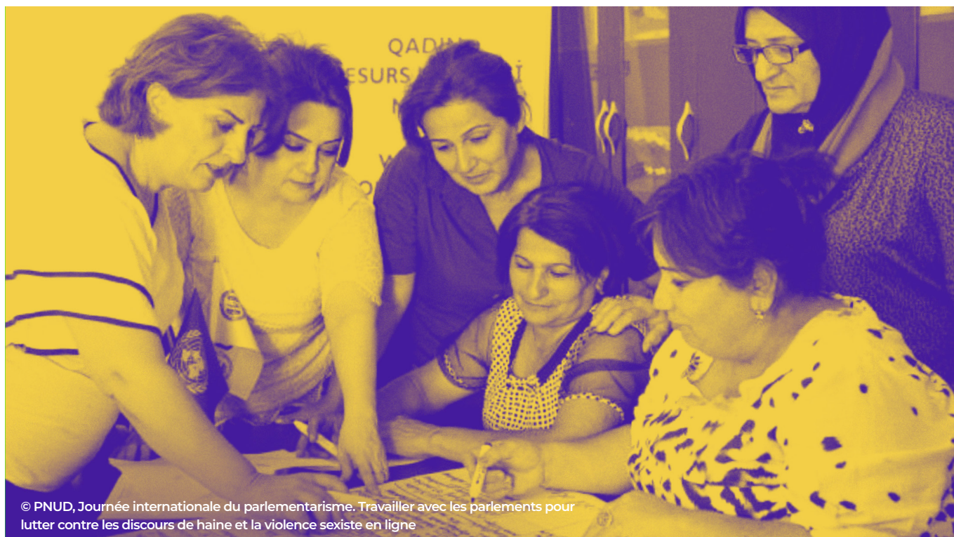
Journée internationale du parlementarisme. Travailler avec les parlements pour lutter contre les discours de haine et la violence sexiste en ligne

Instaurer la justice de genre pour réaliser les droits. Dans son programme mondial sur le renforcement de l'état de droit et des droits humains, le PNUD met l'accent sur la justice de genre en soutenant plus de 48 pays et contextes touchés par une crise, une fragilité ou un conflit. Avec le concours de partenaires comme ONU-Femmes et grâce à des initiatives telles la Plateforme pour la justice