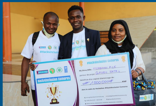
Premier HACKATHON appuyé par le PNUD en 2021

L'inclusion numérique est essentielle pour accélérer le développement du pays et favoriser l'inclusion sociale et économique de toutes et de tous.