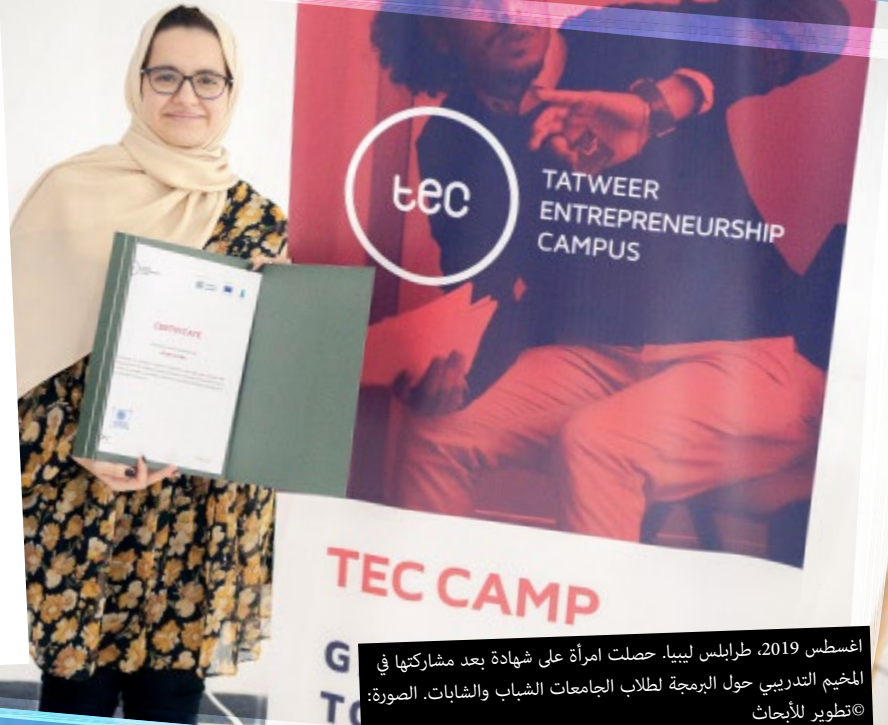
أغسطس 2019، طرابلس ليبيا. حصلت امرأة على شهادة بعد مشاركتها في المخيم التدريبي حول البرمجة لطلاب الجامعات الشباب والشابات.