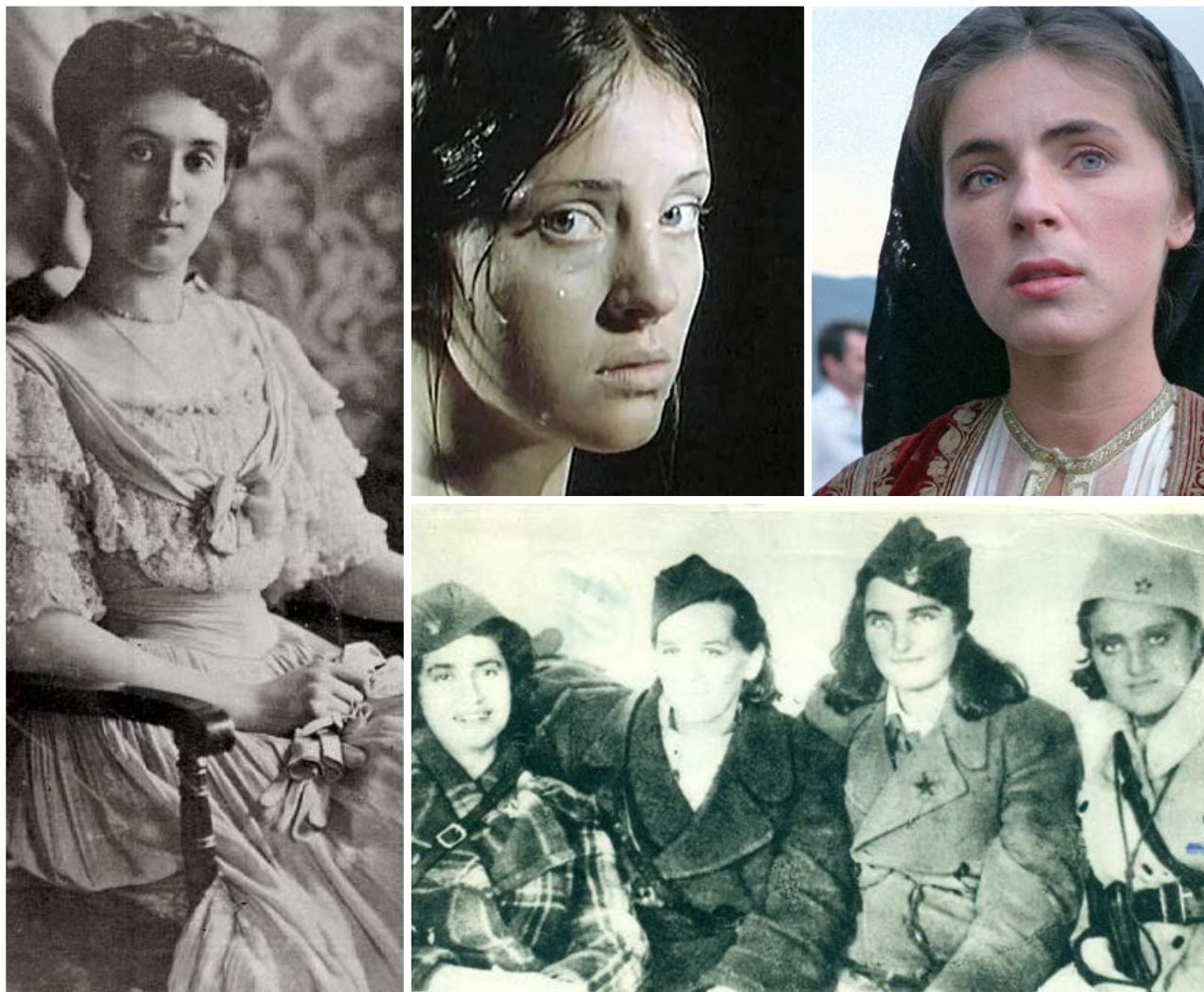
Ilustracije: realne i imaginarne heroine: Princeza Ksenija Petrović Njegoš, Merima Isaković u filmu Jovana Lukina, Mira Furlan u filmu Lepota poroka, crnogorske parizanke i učesnice NOB-a

34% opisuje potrebu za solidarnošću i komunikacijom među ženama i poštovanjem etičkih principa; 49% žena izražava „iritaciju feminizmom“, dok neke (druga polovina) za neuspjeh feminističkog projekta krive „tradicionalni mentalitet Crne Gore“. 21