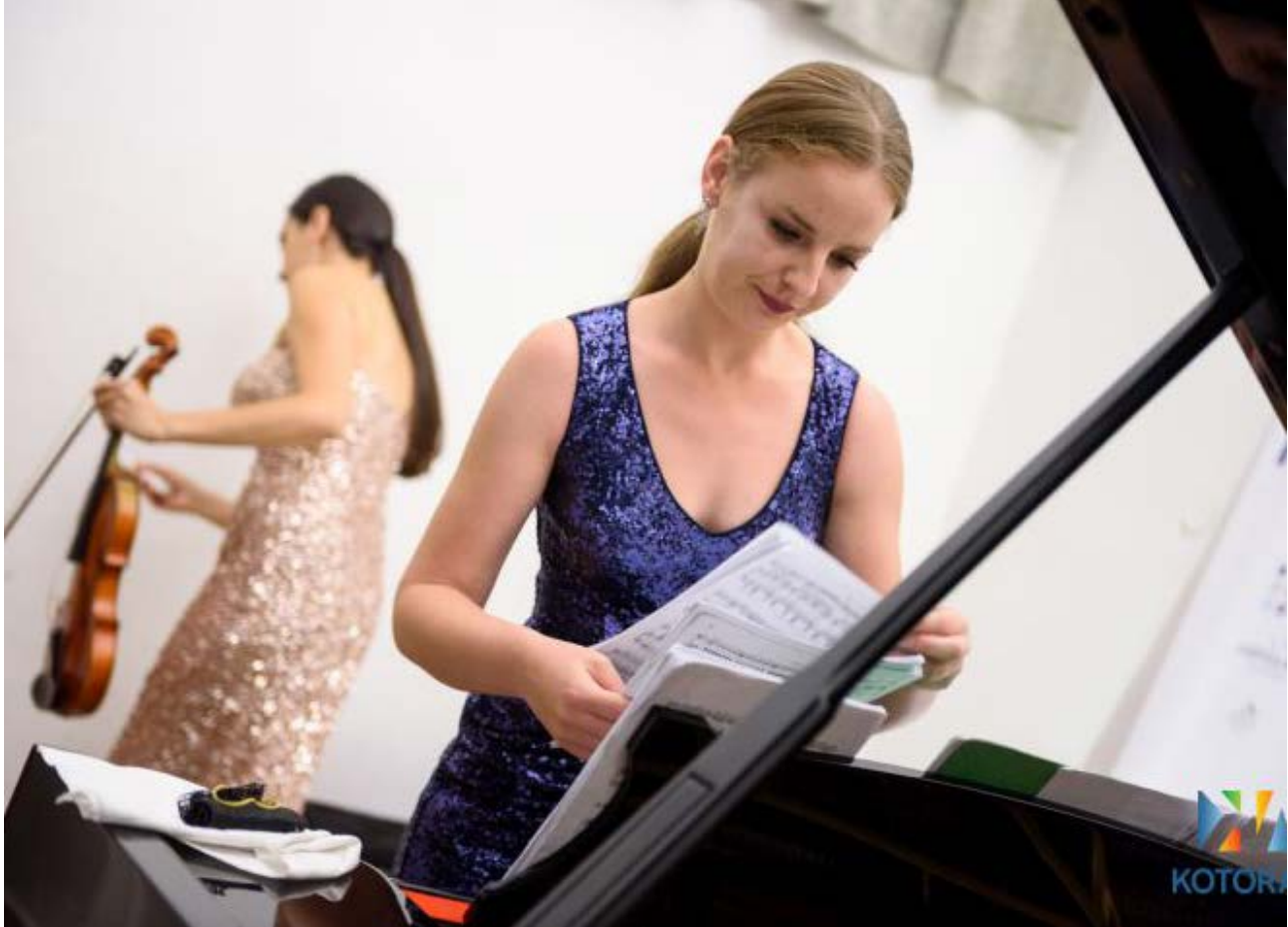
Ilustracija: Manifestacija od posebnog značaja za kulturu Crne Gore - Kotor Art

Govoreći o načinima poboljšanja položaja žena u kulturi i njihovog društvenog statusa, generalno 81% profesionalki izražava ideju da su žene nedovoljno zastupljene u kulturi i da je potrebna veća solidarnost među ženama , dok 69% žena opisuje potrebu za eliminacijom nepotizma, reformom obrazovnih i kulturnih institucija, unapređenjem kadrovskih sposobnosti i standarda rada.