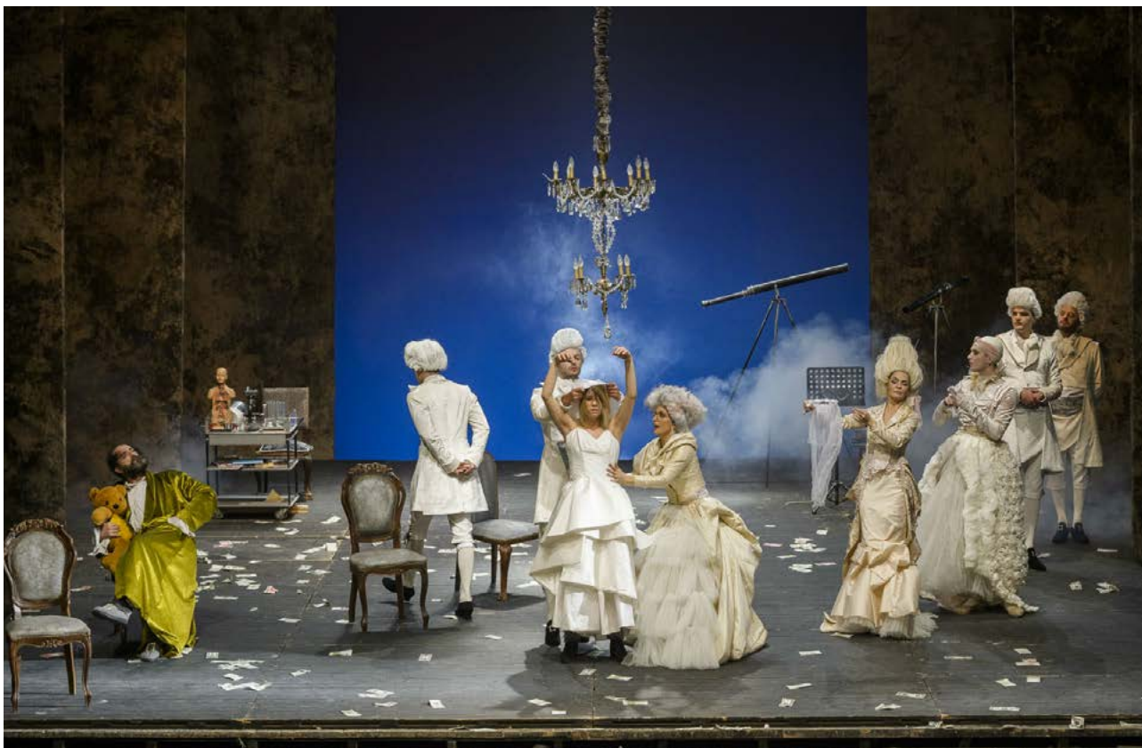
Ilustracija: Predstava "Učene žene", Jagoš Marković, CNP

Slično prethodnom istraživačkom upitniku, u početku je većina odgovora rodno neutralna ili rodno-brišuća, ali kako se proces odgovaranja nastavlja, odgovori postaju sve više objelodanjujući. Iako većina opisa rodne diskriminacije ostaje na nivou intimnog/subjektivnog/anegdotalnog, oni se takođe transformišu u generalizirajuće principe rodne ravnopravnosti i univerzalne prizvuke društvene pravde, uopšte.