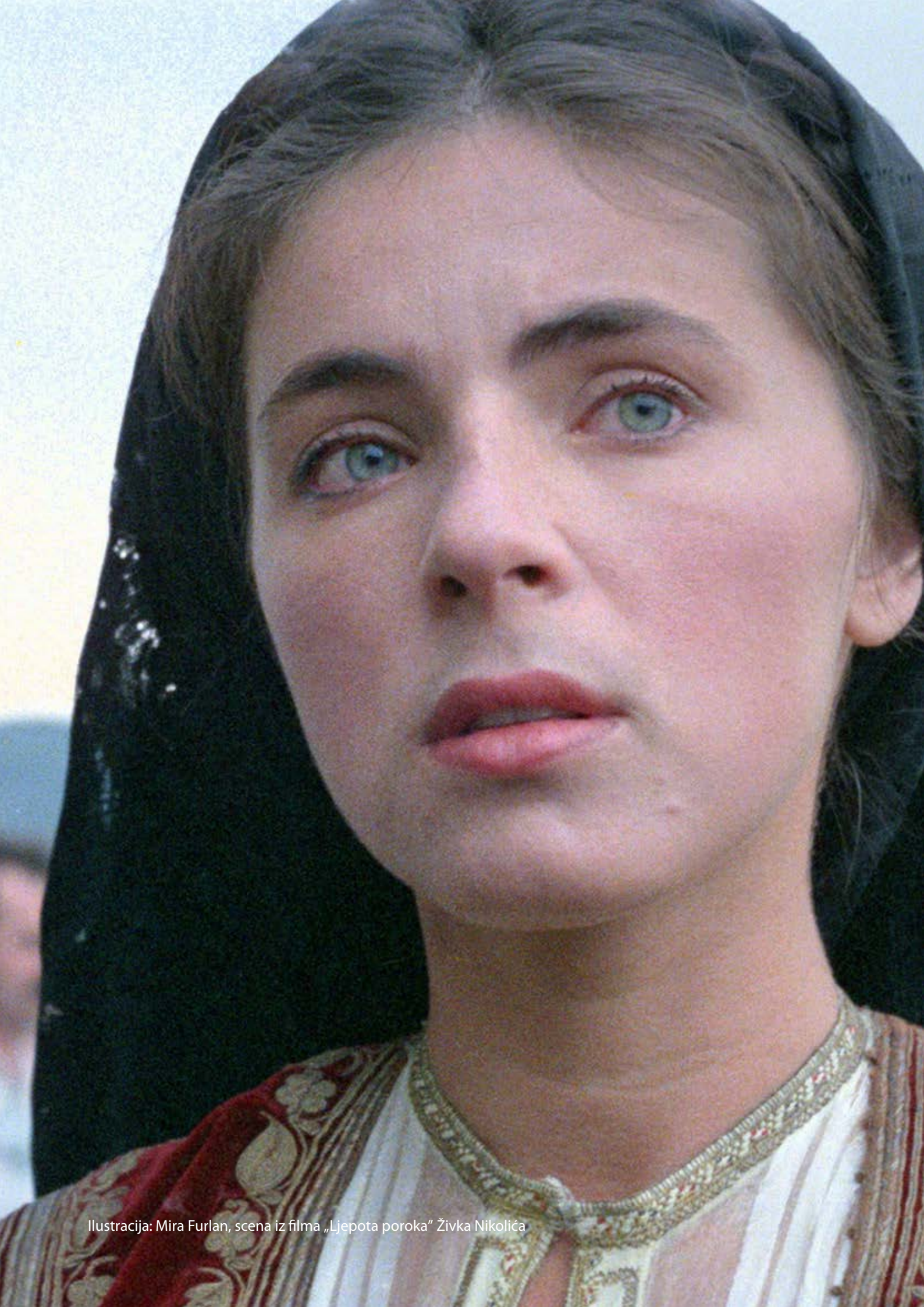
Ilustracija: Mira Furlan, scena iz filma „Ljepota poroka“ Živka Nikolića