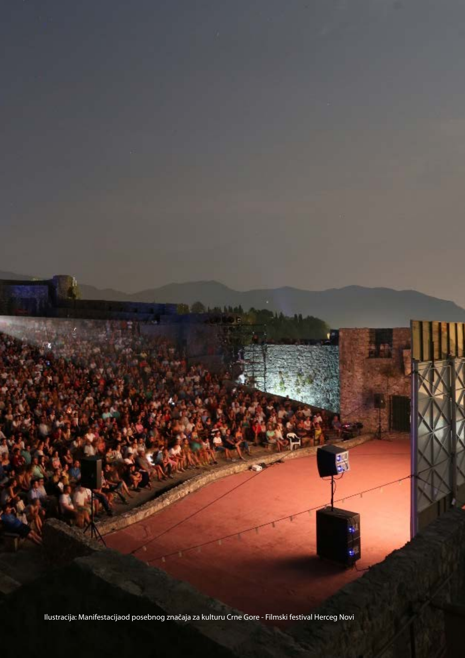
Ilustracija: Manifestacija od posebnog značaja za kulturu Crne Gore - Filmski festival Herceg Novi