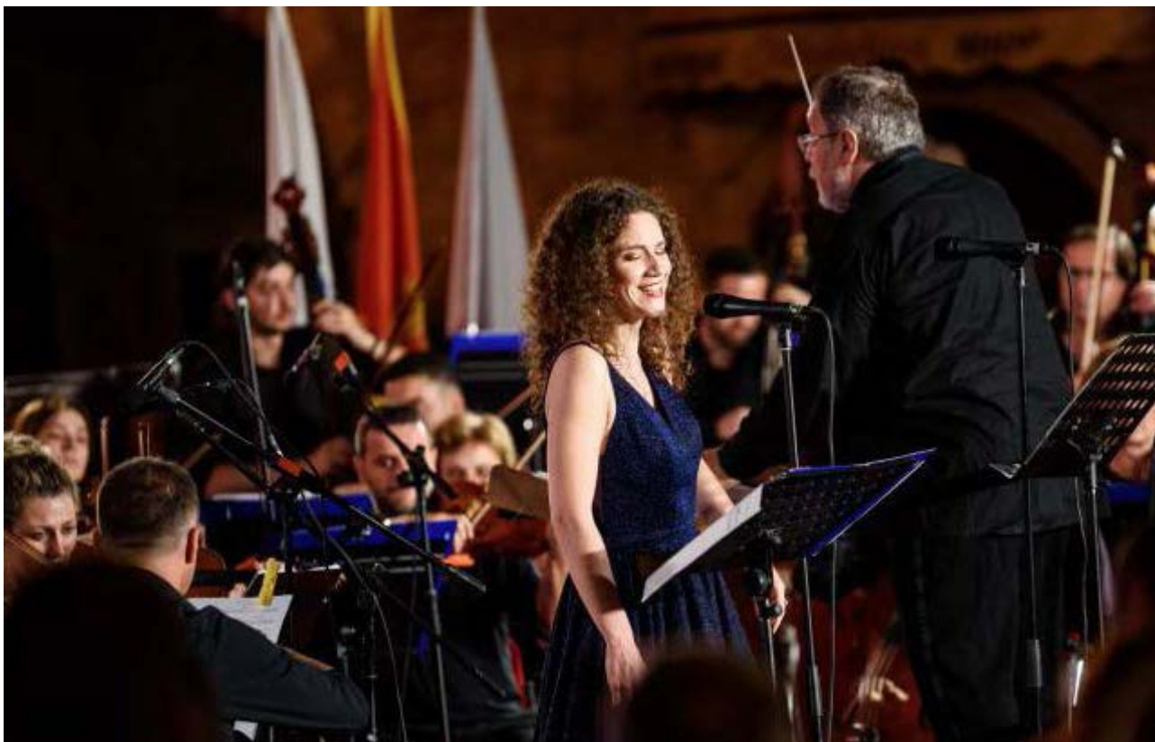
Ilustracija: umjetnica, muzičarka, operna pjevačica Olivera Tičević

Većina medija u Crnoj Gori (tradicionalnih i novih) i dalje koristi riječ „dama“ kada se obraća ženama u bilo kom životnom ili profesionalnom poduhvatu, a posebno da čestita ženama „njihov dan“ 8. mart, rođendane, Sveti Valentin, ali nikada na Dan majki (prema njihovim standardima, majke ne mogu biti majke i dame istovremeno). Važno je napomenuti da isti termin koriste i žene kada se obraćaju drugim ženama, bilo u službenom obraćanju ili u privatnoj komunikaciji. Ovo naglašava potrebu za više diskusija o prisvajanju patrijarhalnih obrazaca i diskursa, kako od strane muškaraca tako i od strane žena.