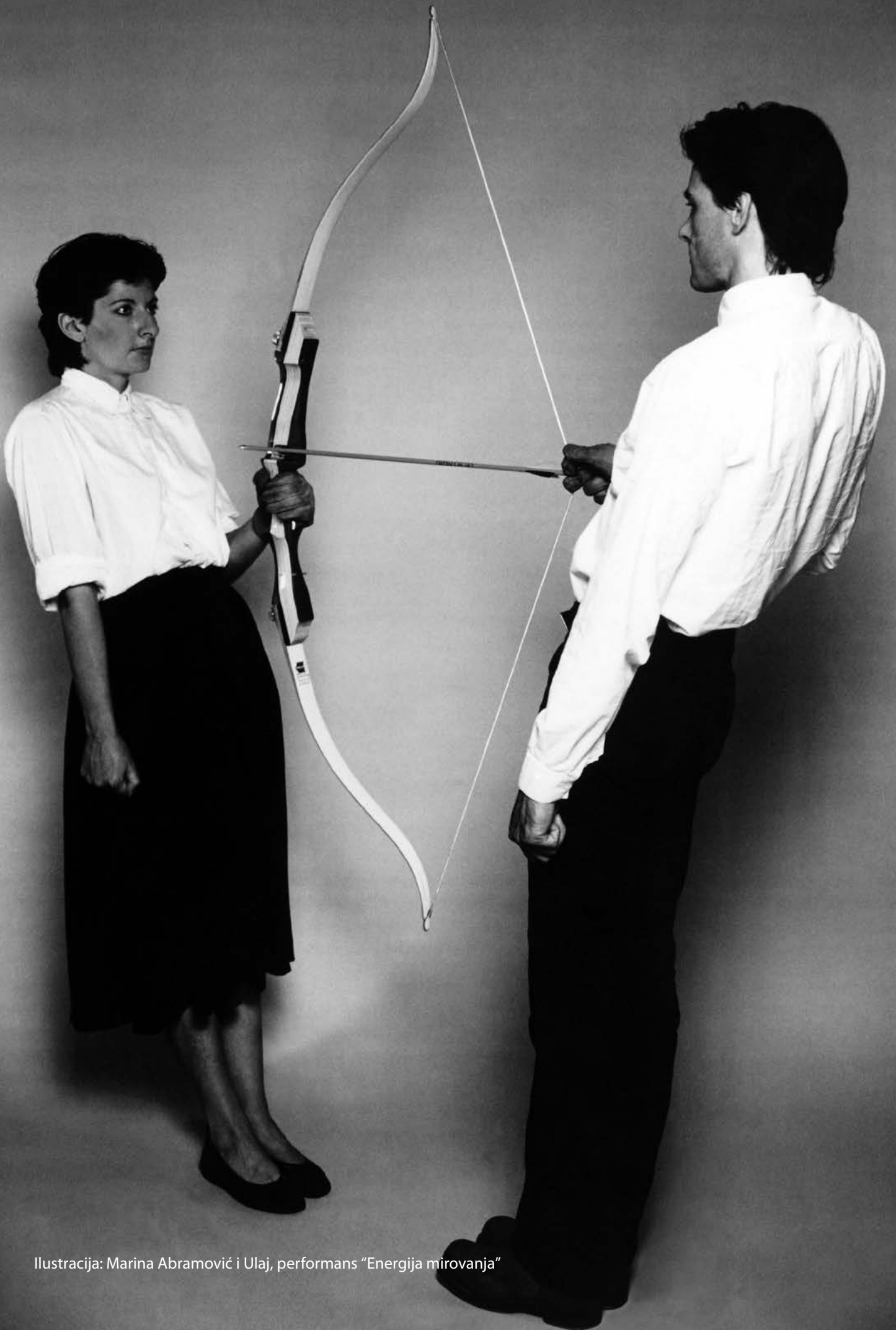
Ilustracija: Marina Abramović i Ulay, performans "Energija mirovanja"