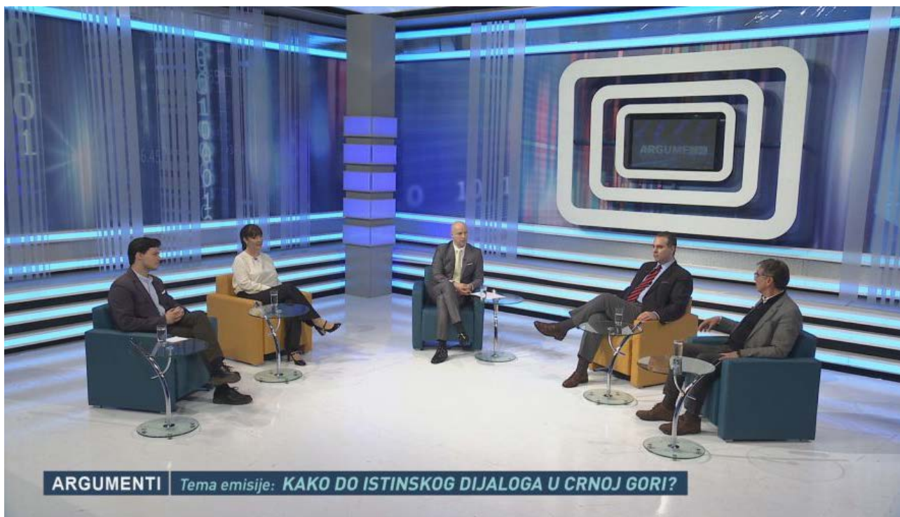
Ilustracija: RTCG „Argumenti“ - prisustvo žena u talk show emisijama

Objektivizacija žena je posebno primjetna na televiziji jer TV kamere različito snimaju žene i muškarce, fokusirajući se na različite djelove ženskog tijela, najčešće do detalja.