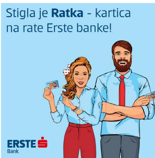
Ilustracije: reklame banaka u Crnoj Gori