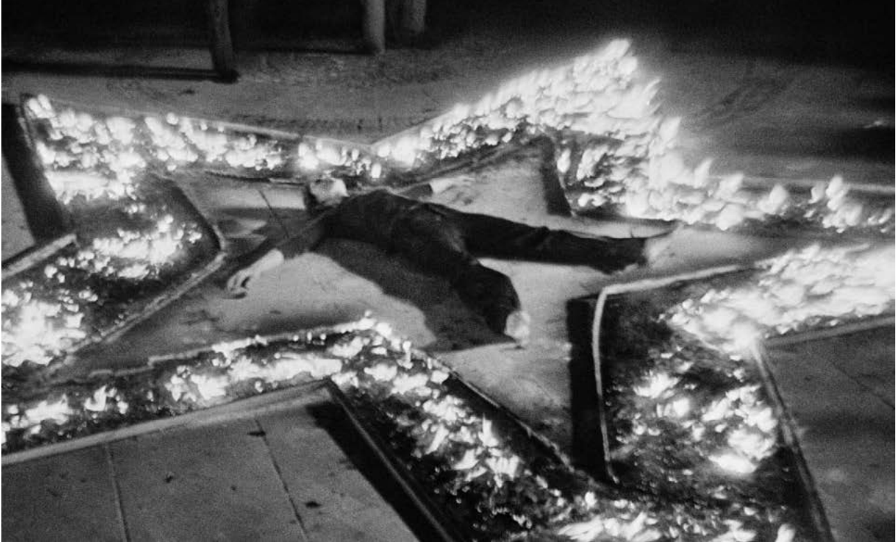
Ilustracija: performans "Ritam 5", Marina Abramović