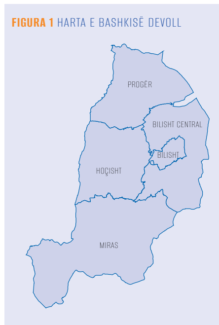
FIGURA 1 HARTA E BASHKISË DEVOLL