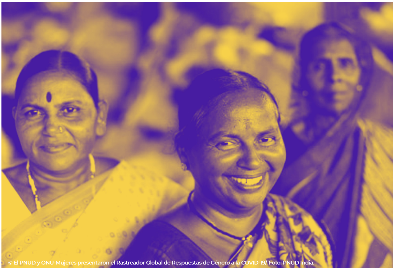
© El PNUD y ONU-Mujeres presentaron el Rastreador Global de Respuestas de Género a la COVID-19. Foto: PNUD India.

En este contexto, el PNUD cuenta con una capacidad excepcional para adoptar un enfoque que abarque a toda la sociedad y ayudar a los Gobiernos a ampliar las opciones nacionales de desarrollo que funcionan para todos. En los últimos 56 años, el PNUD ha generado credibilidad y confianza. Nuestra presencia en 170 territorios a través del nexo acción humanitaria-desarrollo ofrece una incomparable visión de 360 grados de la sociedad en los países donde llevamos a cabo nuestra labor. La presente estrategia de igualdad de género exige que se tomen medidas ambiciosas, y la igualdad de género es una de las contribuciones más importantes que el PNUD, como organización, puede hacer al desarrollo humano y sostenible.