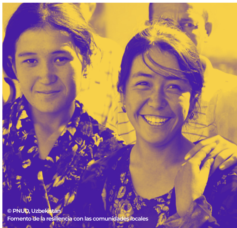
© PNUD, Uzbekistán Fomento de la resiliencia con las comunidades locales

Una recuperación económica resiliente para promover la igualdad de género. Las soluciones de recuperación y estabilización ofrecen un margen importante para poner en marcha cambios estructurales a largo plazo, reajustar las normas sociales negativas y crear oportunidades para la participación plena e igualitaria de las mujeres en la vida económica. A partir de las enseñanzas extraídas de las evaluaciones, el PNUD