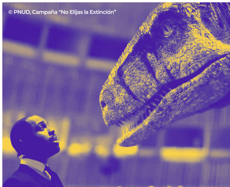
© PNUD, Campaña "No Elijas la Extinción"

El PNUD ampliará su colaboración con el PNUMA, la FAO, la Organización de Cooperación y Desarrollo Económicos (OCDE), la Convención Marco de las Naciones Unidas sobre el Cambio Climático, el Convenio sobre la Diversidad Biológica, la Convención de las Naciones Unidas de Lucha contra la Desertificación y otros asociados especializados. También ampliará su alianza con las organizaciones de la sociedad civil, en particular a través de la Coalición de Acción Feminista por la Justicia Climática.