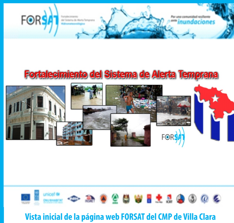
Vista inicial de la página web FORSAT del CMP de Villa Clara

Para compartir tanto datos de monitoreo meteorológico como hidrológico desde un nodo central que administra el Centro Meteorológico Provincial de Villa Clara, sus especialistas conformaron una página web en el marco de FORSAT, específicamente para los usuarios que van a estar conectados a la Red inalámbrica (RLAN).