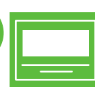
Invitaciones para personas beneficiarias al evento.