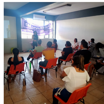
Divulgación de casos de éxito donde las mujeres son lideresas comunitarias.