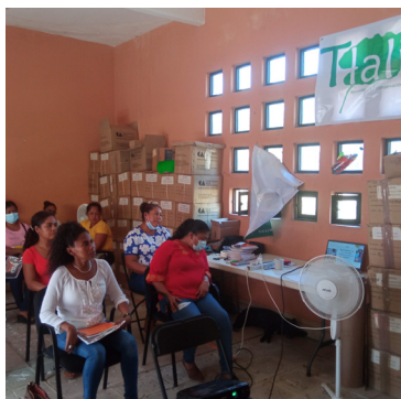
Agenda sobre el derecho a la salud de las mujeres.