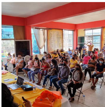
Clase magistral a servidores públicos sobre el ABC del género y la perspectiva de género en la administración pública.