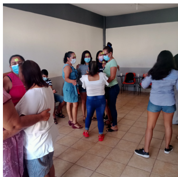
Taller sobre los derechos de las mujeres afromexicanas: agendas y liderazgos.