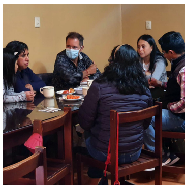
Mesas de trabajo con mujeres líderes, ex autoridades y/o autoridades municipales del régimen de sistemas normativos indígenas.