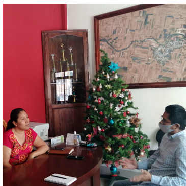
Entrevistas a presidentas municipales.