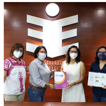
Presentación de la guía de buenas prácticas para la implementación de la paridad en los municipios de sistemas normativos indígenas del estado de Oaxaca (versión digital completa y ejecutiva).