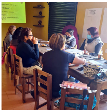
Taller con mujeres de municipios de sistemas normativos indígenas.