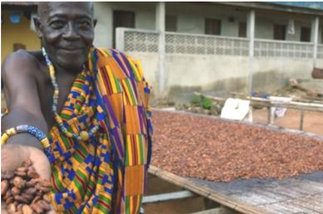
Chef de village ghanéen avec des fèves de cacao

Impact sur le développement: Formation et assistance technique ont été fournies par le Partenariat cacao de Cadbury à environ 100 communautés productrices de cacao, ce qui a amélioré les revenus et les moyens de subsistance des communautés.