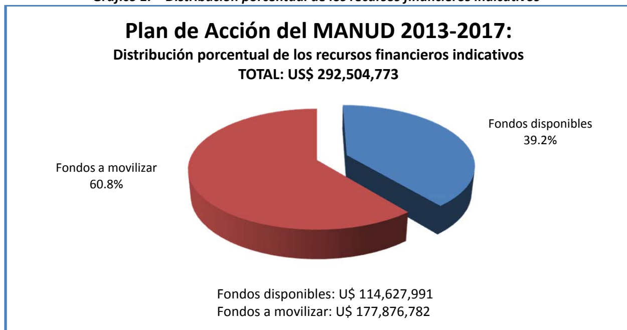
Gráfico 1. – Distribución porcentual de los recursos financieros indicativos

La tabla a continuación refleja el monto estimado por área de cooperación para las categorías de: fondos disponibles y fondos a movilizar.