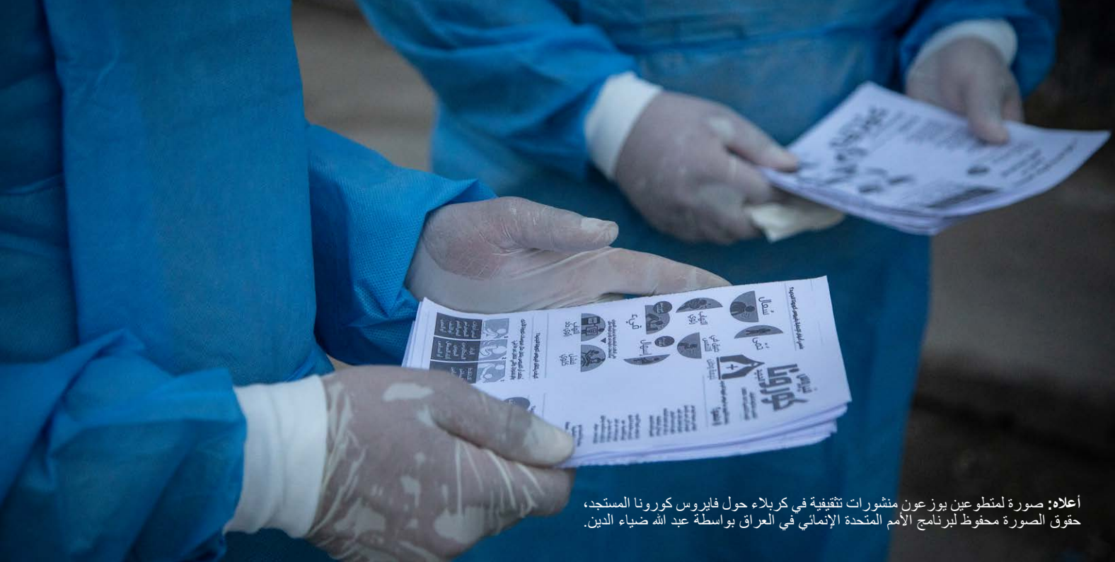
أعلاه: صورة لمتطوعين يوزعون منشورات تثقيفية في كربلاء حول فيروس كورونا المستجد، حقوق الصورة محفوظة لبرنامج الأمم المتحدة الإنمائي في العراق بواسطة عبد الله ضياء الدين.