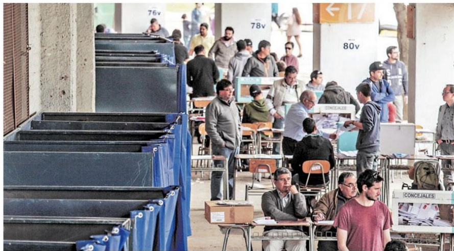
► En las municipales 2016 la abstención llegó a un 65% en el país.

"Se ha profundizado una tendencia que venía de antes y es preocupante sobre todo porque Chile está muy fuera de la tendencia en América Latina. En la gran mayoría de países de la región aumenta o se mantiene. Aunque en muchos de ellos hay voto obligatorio, incluso en los dos países que pasaron a voto voluntario, Venezuela y Guatemala, ninguno tuvo una caída en participación como la nues-