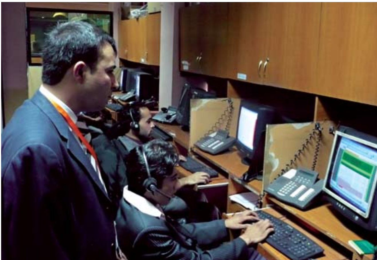
Un centro de atención telefónica de consultas electorales respaldado por el PNUD en el Afganistán recibió casi medio millón de llamadas hasta el final de 2008.

El PNUD cuenta con distintas iniciativas que se ocupan de asuntos de gobernanza tanto a nivel regional amplio como a nivel nacional y local. En 2008, el PNUD suministró una combinación de apoyo técnico, financiero y normativo a democracias incipientes o que luchaban por sobrevivir, entre ellas Maldivas , Papua Nueva Guinea y la República Unida de Tanzania . El programa de profundización de la democracia en la República Unida de Tanzania, apoyado tanto por el PNUD, el Gobierno y donantes internacionales, presta asistencia técnica y financiera a distintas instituciones, incluidos el Parlamento,