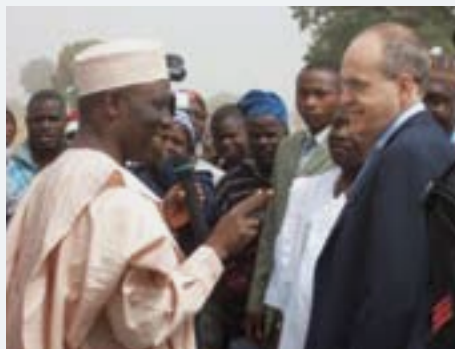
El Administrador Asociado del PNUD, Ad Melkert, escucha las observaciones de Patrick Ibrahim Yakowa, Gobernador Adjunto del estado de Kaduna en Nigeria, sobre los progresos alcanzados en Pampaida, Kaduna, una de las 13 Aldeas del Milenio de África.

Otras evaluaciones respaldan esta conclusión. El Instituto de Desarrollo de Ultramar, un centro de estudios independiente con sede en Londres, realizó una encuesta sobre la eficacia de siete organismos multilaterales, desde la perspectiva de interesados clave en determinados países en que se ejecutan programas. Reunió las opiniones de gobiernos destinatarios, parlamentos, empresas y organizaciones de la sociedad civil centrándose en la forma en que los organismos multilaterales promueven el sentido de identificación nacional, fomentan la capacidad local y brindan asesoramiento normativo eficaz. Los resultados de esta encuesta asignan al PNUD el primer lugar entre todas las organizaciones multilaterales en relación con el desembolso complementario de asistencia internacional para el desarrollo. Asimismo, el PNUD encabezó la lista de las 30 principales organizaciones de su tipo incluidas en el Global Accountability Report de 2007 publicado por One World Trust del Reino Unido, que se especializa en la esfera de la gobernanza mundial y la