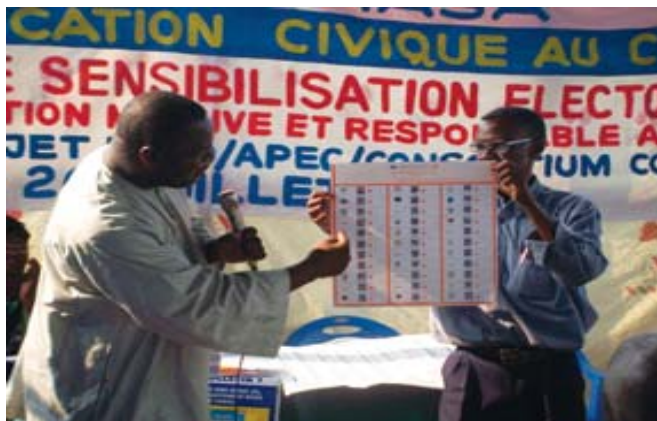
En los momentos previos a las elecciones celebradas en 2006 en la República Democrática del Congo, hubo un taller para mejorar el rendimiento de las personas encargadas de los puntos de votación.

Los líderes mundiales se han comprometido a alcanzar los Objetivos de Desarrollo del Milenio (ODM) para 2015, incluso el objetivo trascendental de reducir la pobreza extrema a la mitad. El PNUD, mediante su red mundial, coordina los esfuerzos mundiales y nacionales para alcanzar dichos objetivos.