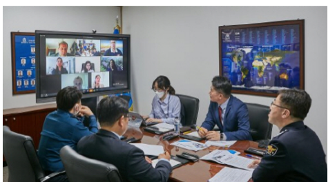
지난 27일 경찰청사에서 유엔개발계획(UNDP) 서울정책센터 (USPC)와 함께 한국 경찰의 코로나19 대응 체계를 소개하는 웹 세 미나를 진행하고 있다

경찰청은 지난 27일 유엔개발계획(UNDP) 서울정책센터 (USPC)와 함께 혁신적인 한국 경찰의 코로나19 대응 체계를 소 개하는 웹 세미나를 개최했다고 밝혔다.