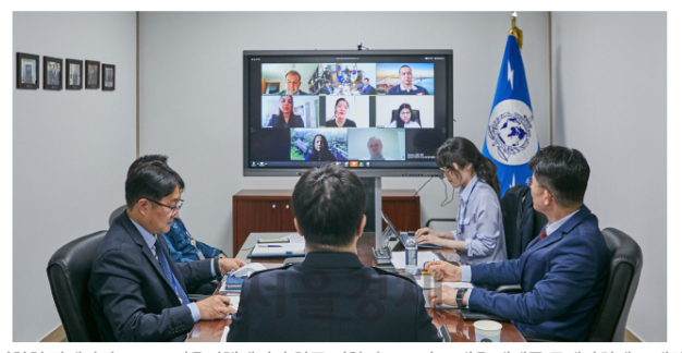
경찰청 관계자와 UNDP 서울정책센터가 한국 경찰의 코로나19 대응 체계를 국제사회에 소개하는웹 세미나를 열고 있다.

경찰청은 유엔개발계획(UNDP) 서울정책센터와 함께 27일 한국 경찰의 신종 코로나바이 러스 감염증(코로나19) 대응 체계를 국제사회에 소개하는 웹(온라인) 세미나를 개최했다고 28일 밝혔다.