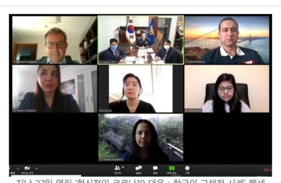
지난 27일 열린 '혁신적인 코로나19 대응 : 한국의 구체적 사례' 웹세 미나 진행장면

韓 경찰 "재난대책본부 24시간 대응"...참석국 한국과 협력관계 확대 희망