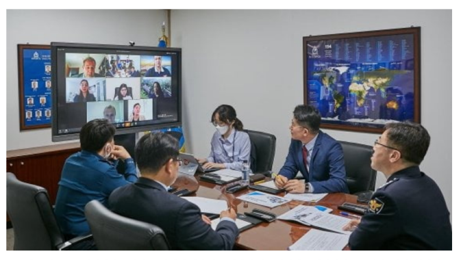
코로나19(신종 코로나바이러스 감염증) 사태에 대한 한국 경찰의 대응 사례가 국제사회에 공유됐다.

코로나 확산 속 한국 경찰 대응 사례 37개국 공유 경찰청 "방역적 경찰 활동에 인적 물적 역량 집중"