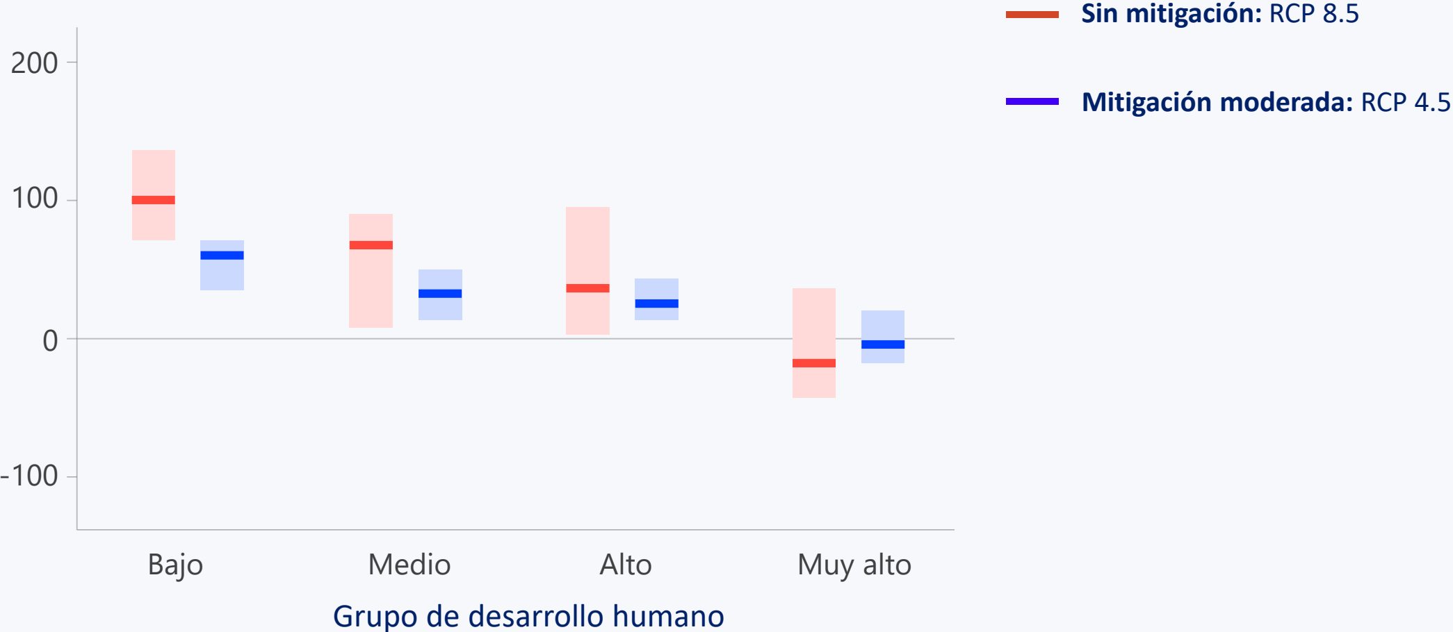
Numero de días adicionales con temperaturas extremas para el año 2100*