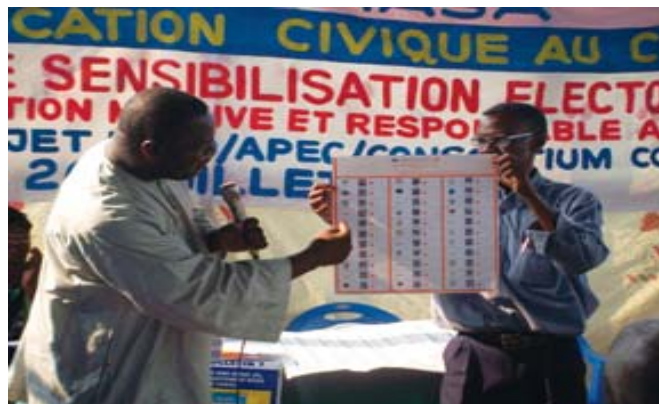
Pendant les préparatifs des élections de 2006 en République démocratique du Congo, une session de formation a permis de renforcer les qualifications des personnes administrant les bureaux de vote.

Les chefs d'État et de gouvernement de la planète se sont engagés à réaliser les objectifs du Millénaire pour le développement (OMD) d'ici 2015, et notamment le premier d'entre eux : réduire de moitié l'extrême pauvreté. Le PNUD, grâce à son réseau planétaire, coordonne les initiatives mondiales et nationales pour atteindre ces objectifs.