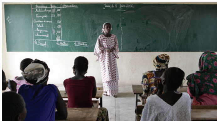
Mujeres en el campo en Senegal asisten a clases de alfabetización.

Incluso los países con planes bien elaborados y financiados de reducción de la pobreza hablan de brechas internas del país en materia de liderazgo y conocimientos, una escasez de experiencia técnica y de dirección, y dificultades para retener al personal talentoso en entornos que ofrecen pocos incentivos. Otra dificultad corriente es una capacidad insuficiente para implementar las leyes, los reglamentos y las políticas necesarias para poner en práctica las estrategias de desarrollo.