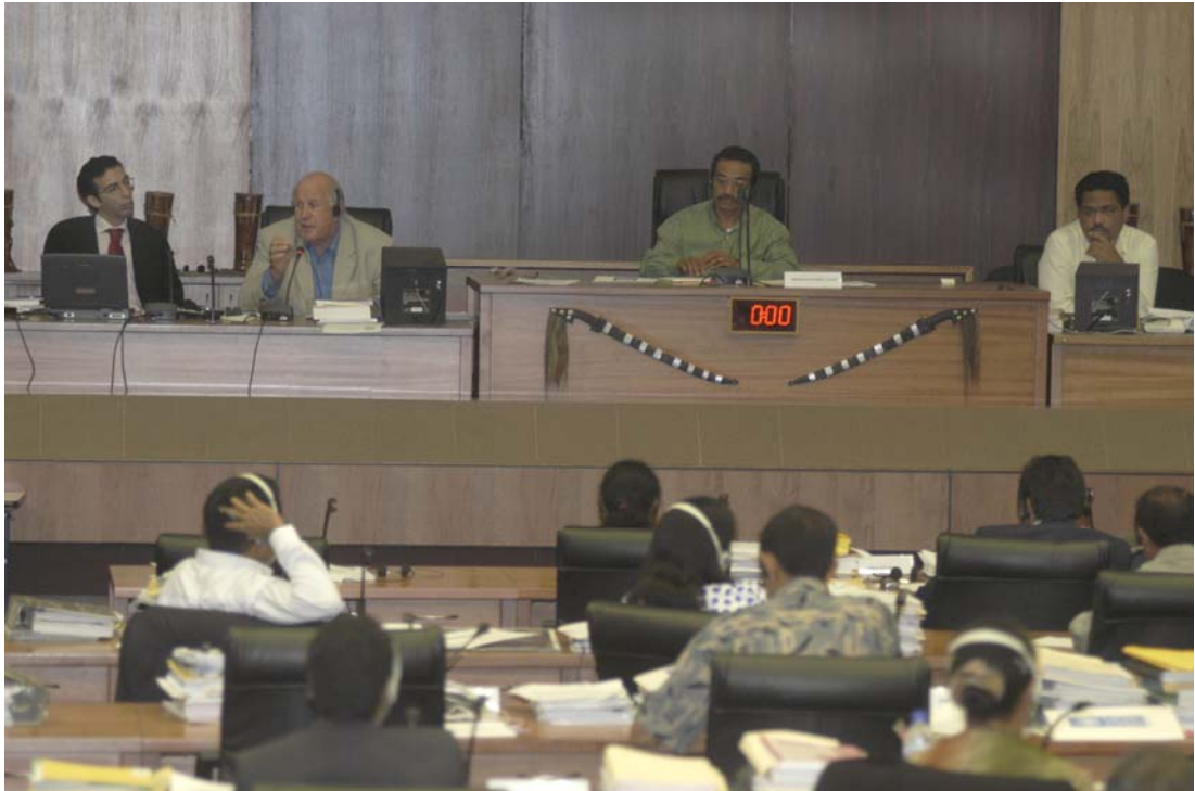
Sr. Francisco Guterres "Lu Olo", Presidente do Parlamento Nacional de Timor-Leste