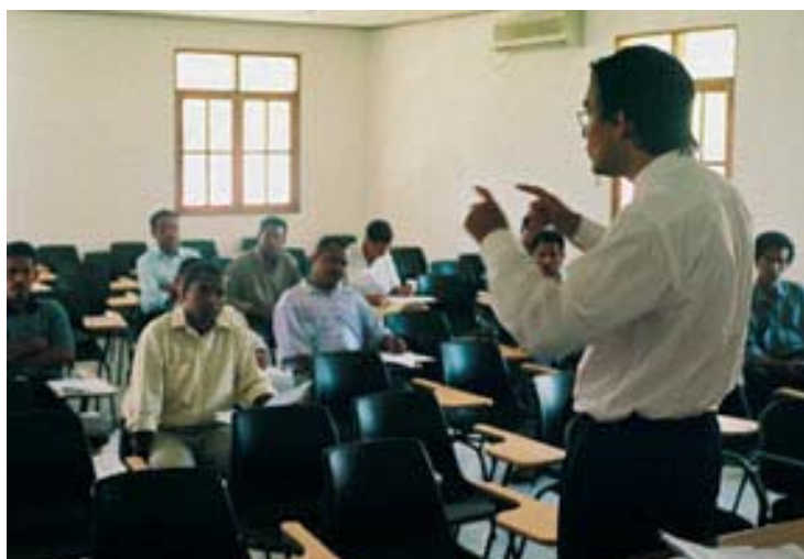
Au lendemain des conflits, le Timor oriental doit renforcer ses capacités juridiques. Le PNUD fait appel à des juristes d'autres pays, tels que Rui Pinto ci-dessus, avocat portugais, pour dispenser une formation dans le cadre d'un programme de mentorat.

La Sierra Leone a connu plus d'une décennie de guerre civile. Elle se classait l'an dernier au dernier rang des 162 pays examinés dans le Rapport mondial sur le développement humain