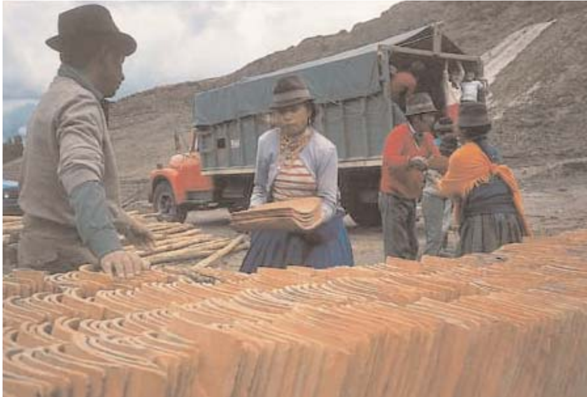
Hombres y mujeres trabajan hombro con hombro en el Ecuador para reducir la pobreza.