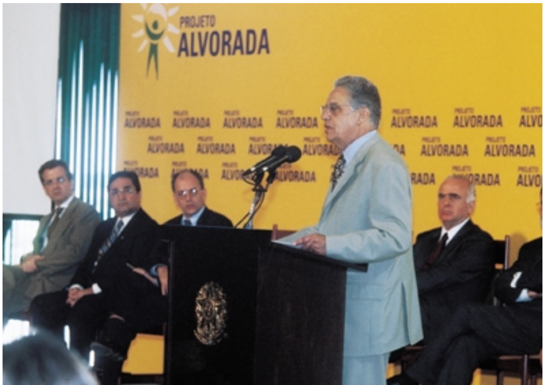
Fernando Henrique Cardoso, Presidente del Brasil, da a conocer el "Programa Alvorada", que abarca los 14 estados brasileños con más bajo índice de desarrollo humano.

En todo el mundo, muchos países – e incluso estados y regiones – preparan ahora informes nacionales sobre desarrollo humano. El Asia meridional fue la primera región integrada por varios Estados que preparó su propio Informe sobre Desarrollo Humano . Los países árabes producirán su primer informe regional, que se dará a conocer en diciembre de 2001. En el último decenio, se han preparado en 134 países más de 350 informes, que han servido como instrumentos de cambio asumidos como propios por las comu-