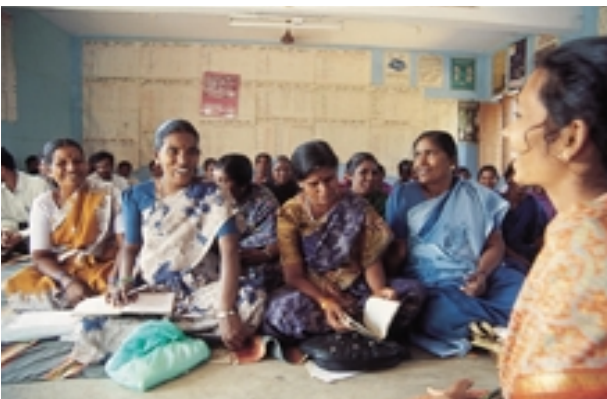
Capacitación en autogobierno para mujeres en la India.

administración pública y ayuda a mejorar la rendición de cuentas y combatir la corrupción. El PNUD contribuyó a captar donantes en apoyo de Nigeria , cuando este país estableció la Comisión contra la Corrupción y preparó un plan de acción.